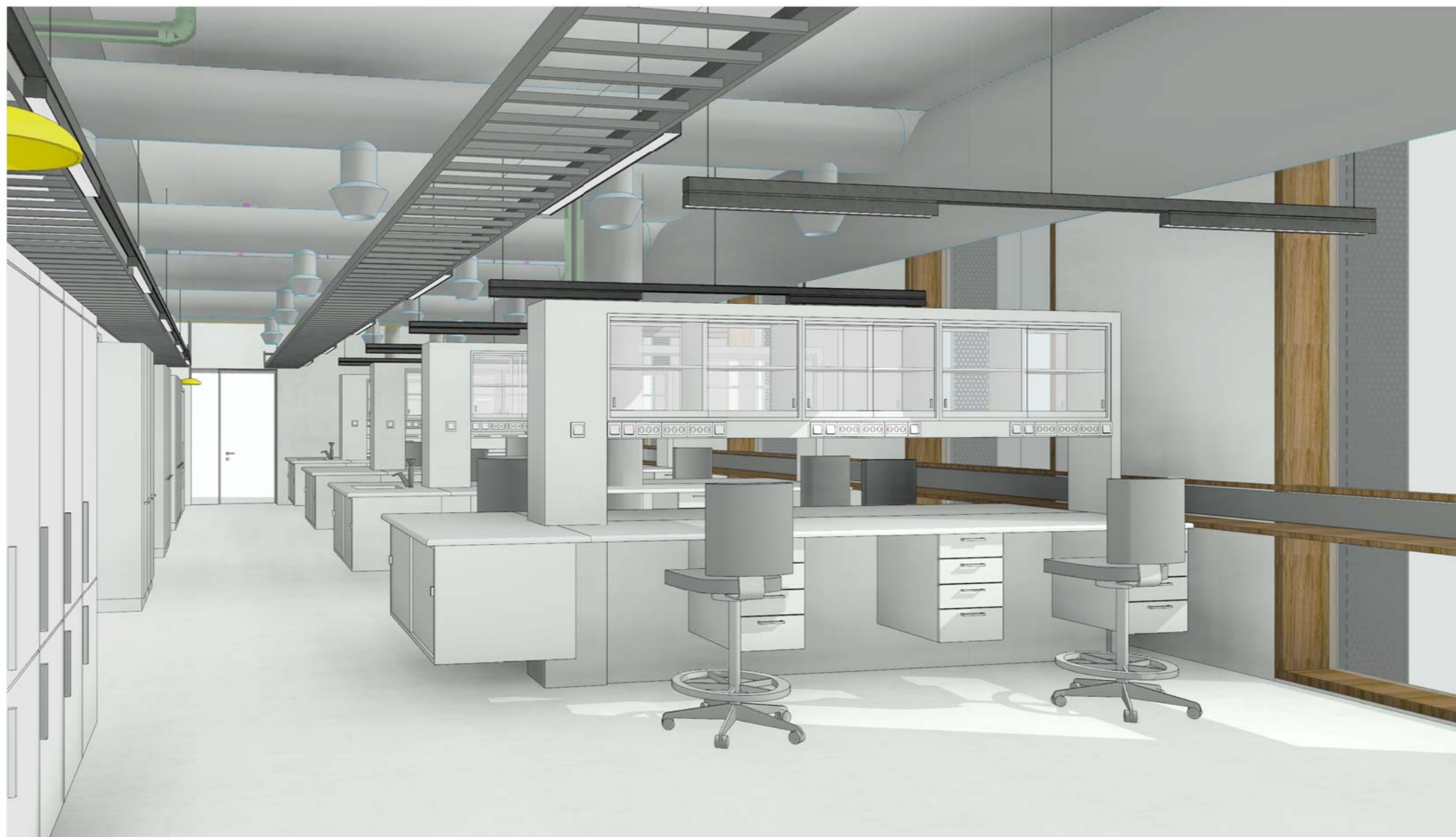
LAB - ILLUSTRASJON, UTSNITT SKRÅTT MOT FASADE.