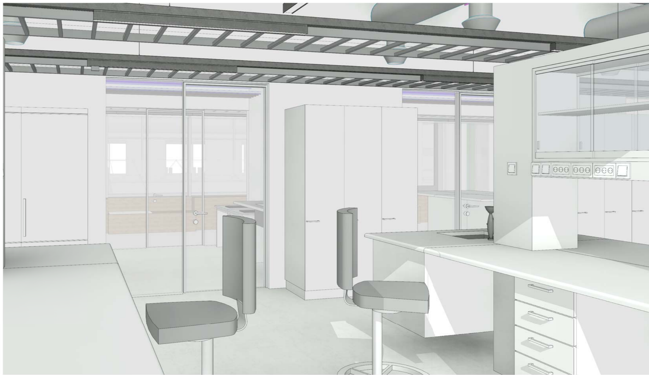
LAB - ILLUSTRASJON, MOT LYSGÅRD.