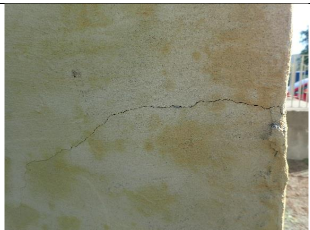
Eksempel på sprekk mot hjørne, vestfasade