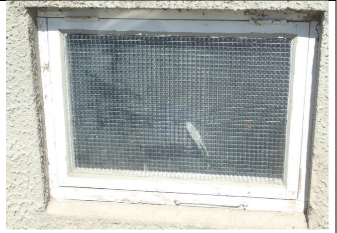
Vindu 2, Rekittet i nyere tid med silikonbasert kitt, sprekk i bunnkarm