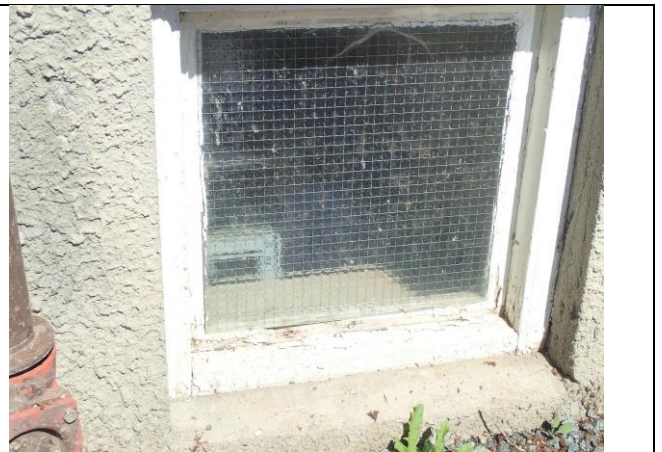
Vindu 4 med skadet bunnramme og -karm