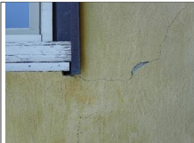
Eksempel på riss og sår i puss, vestfasade