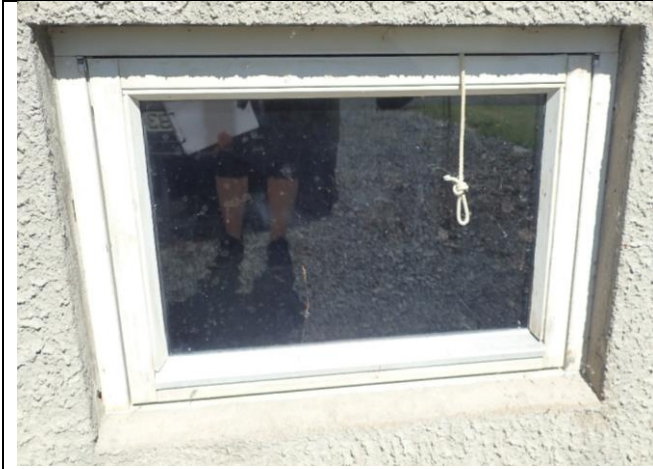
Vindu 1, nyere vindu