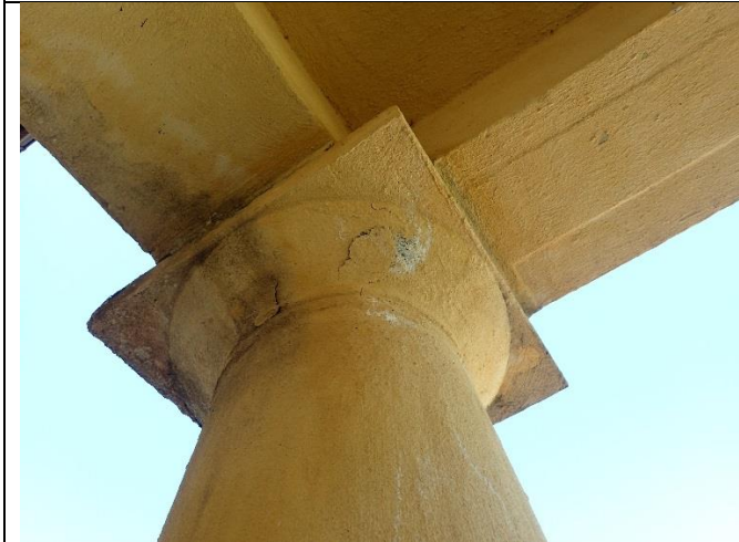
Detalj av søyle under balkong mot øst