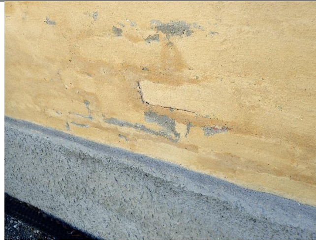
Detalj av pussflate, nordfasade