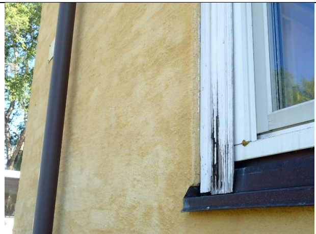
Råteskadet vindusomramming på vestfasade, markert med rød sirkel på fasadebilde