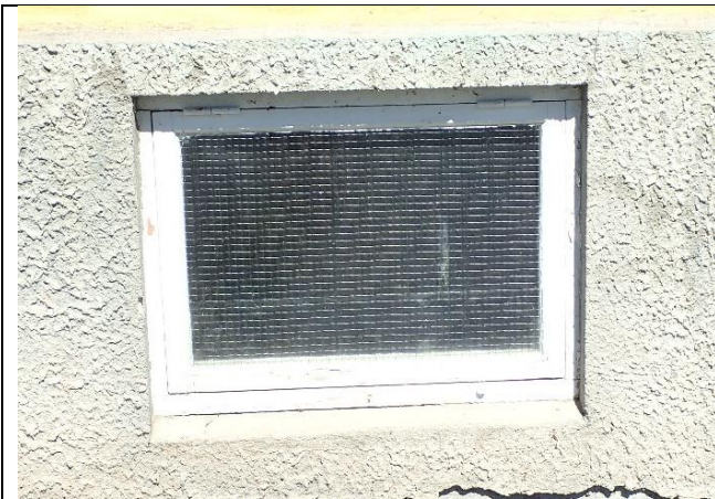
Vindu 3 med trådglass