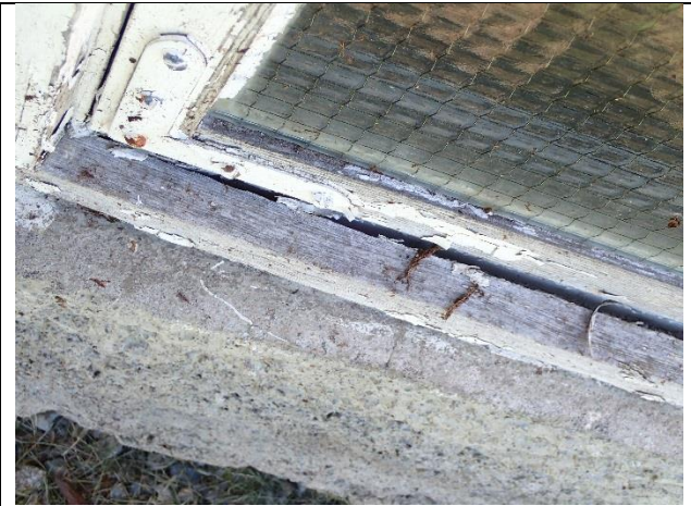
Vindu nr 5: Del av bunnkarm buler ut