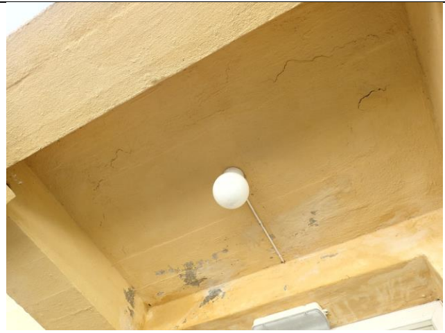
Under balkong mot vest. Korrodering, frostsprengning