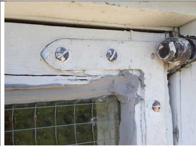
Vindu nr 2: Vindu er rekittet i nyere tid med silikonbasert kitt. Ramme er oppsprukket