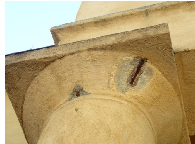
Detalj av søyle under balkong mot vest