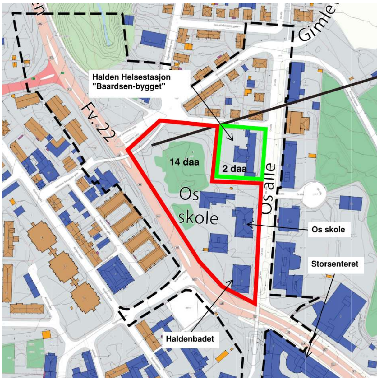
Figur 1: Reguleringsområdet med Os-tomten i rødt

Prosjektet skal samle elevene fra Os og Rødsberg skoler. Tomten er 16 daa (16.000 m 2 ) og består av Halden bad, «Baardsen-bygget» og Os skole med tilhørende SFO og gymsal. «Baardsen-bygget» skal i tillegg til gamle Os skole beholdes, det er et område på 2 daa, mens øvrig bebyggelse på tomten skal rives. Riving skal gjennomføres som en separat forberedende entreprise.