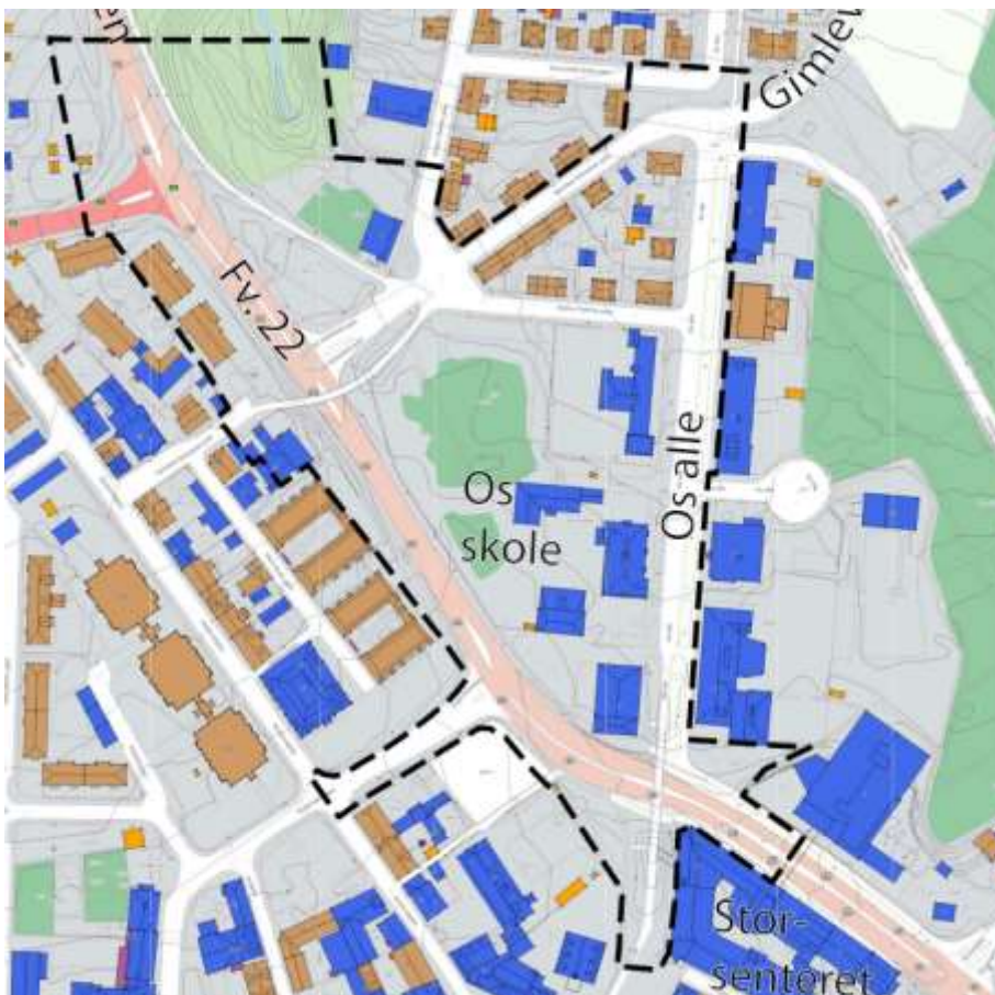
Figur 2 - Foreslått plangrense for planarbeid, "Detaljregulering for Os oppvekstsenter"

Planområdet er i gjeldende reguleringsplan fra 1978 regulert til skole, lek og veiareal. Høydebegrensningen er 4 etasjer. Arealet er lavt utnyttet og har en arrondering som forsterker støy/støvproblemer. I sentrumsplanen fra 2017 er arealformålet offentlig bebyggelse og maks byggehøyde 14 m. Området skal detaljreguleres som en del av prosjektet. Planarbeidet skal foregå parallelt med utvikling av prosjektet og er en del av kontraktsarbeidet. Detaljreguleringen må skreddersys til prosjektet som blir valgt og er antatt å kunne bli vedtatt i juni 2019. Varsel om oppstart av planarbeid ble sendt ut 01.02.2018.