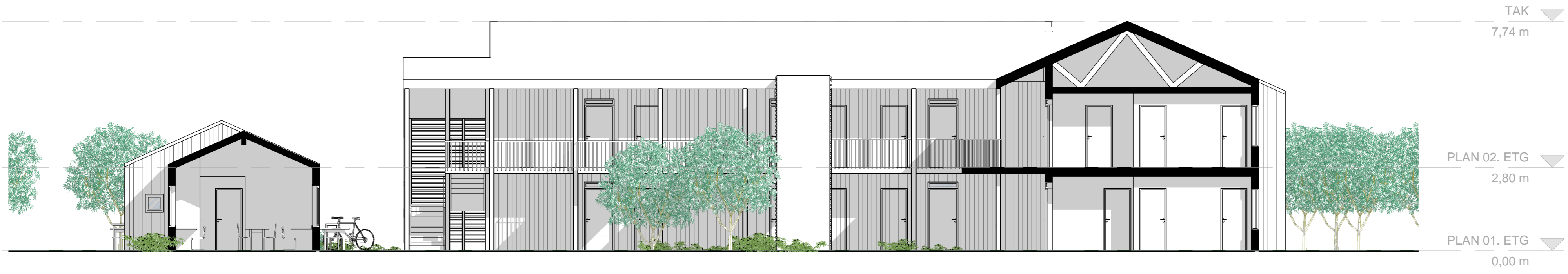
Section 1 1 : 100