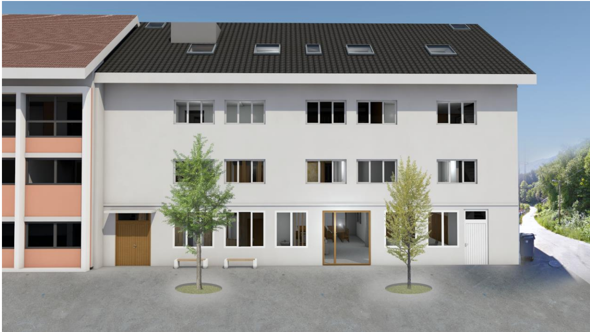
H0580 MO senter i Eidsvåg

KONKURRANSEGRUNNLAGETS DEL II FUNKSJONSBEKRIVELSE