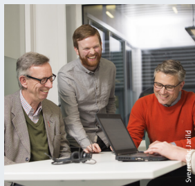
Digital samhandling og dokumenthåndtering