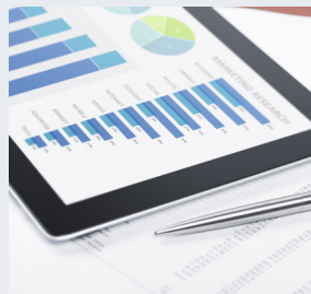
Strategisk datafangst, deling og utnyttelse av data