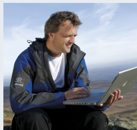
Brukerfront og digitale tjenester