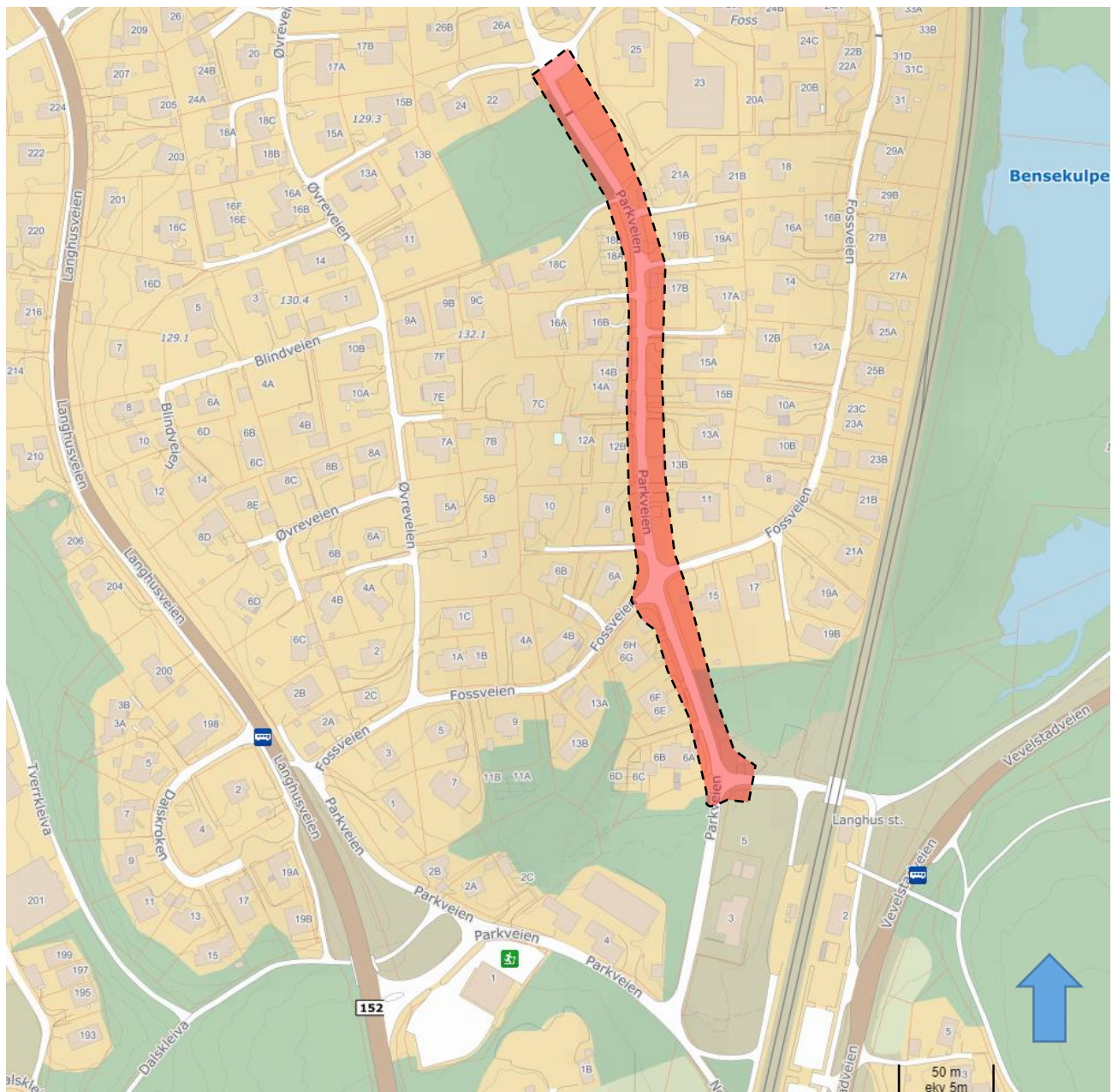
Oversiktskart – Parkveien - Rehabilitering av VA