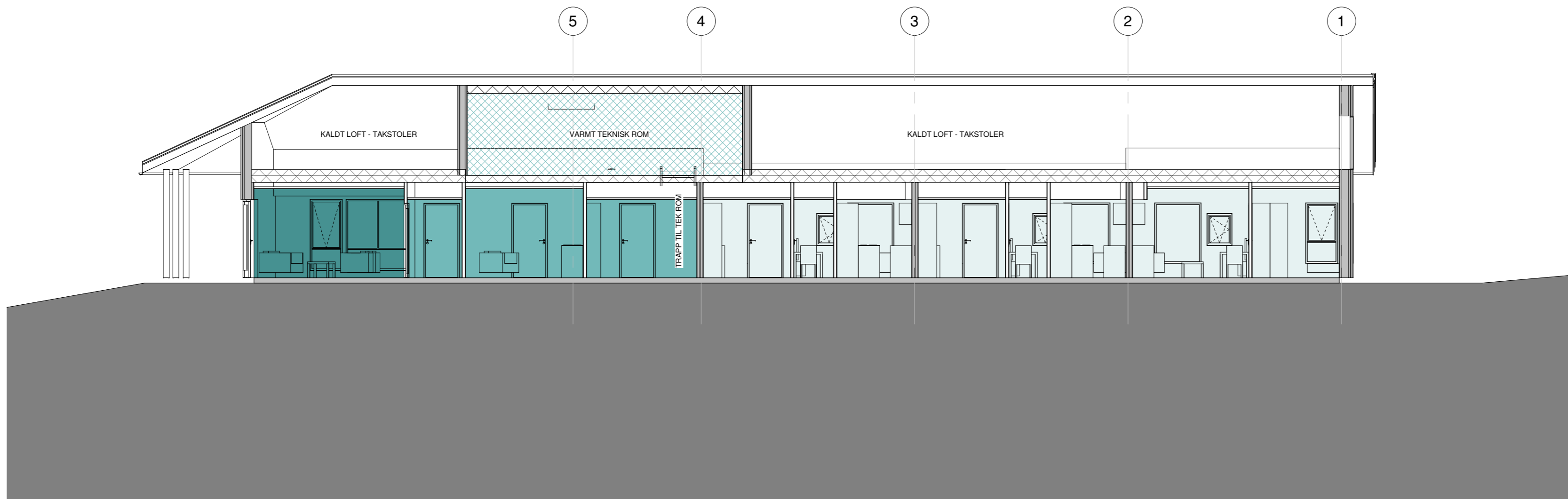
4 DD 1 : 100