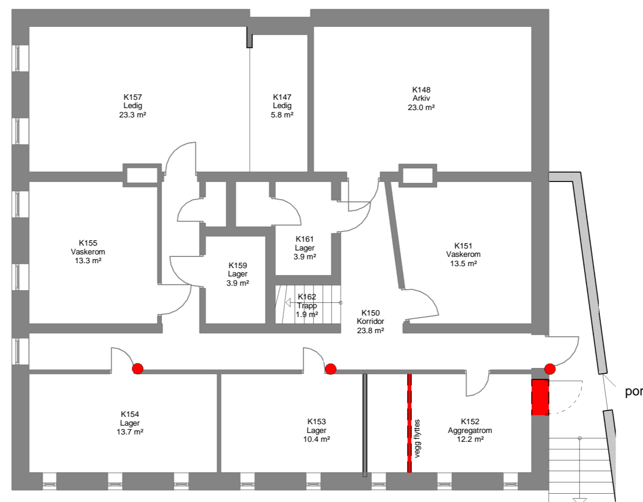
4 Riveplan Kjeller 1 : 100