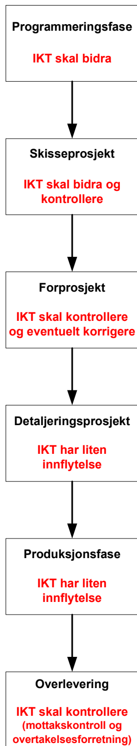
Figur 2. Byggfaser

Et byggeprosjekt inndeles i ulike faser. Figur 2 og 3 illustrerer i hvilke faser IKT-personell skal, har mulighet for å bidra.