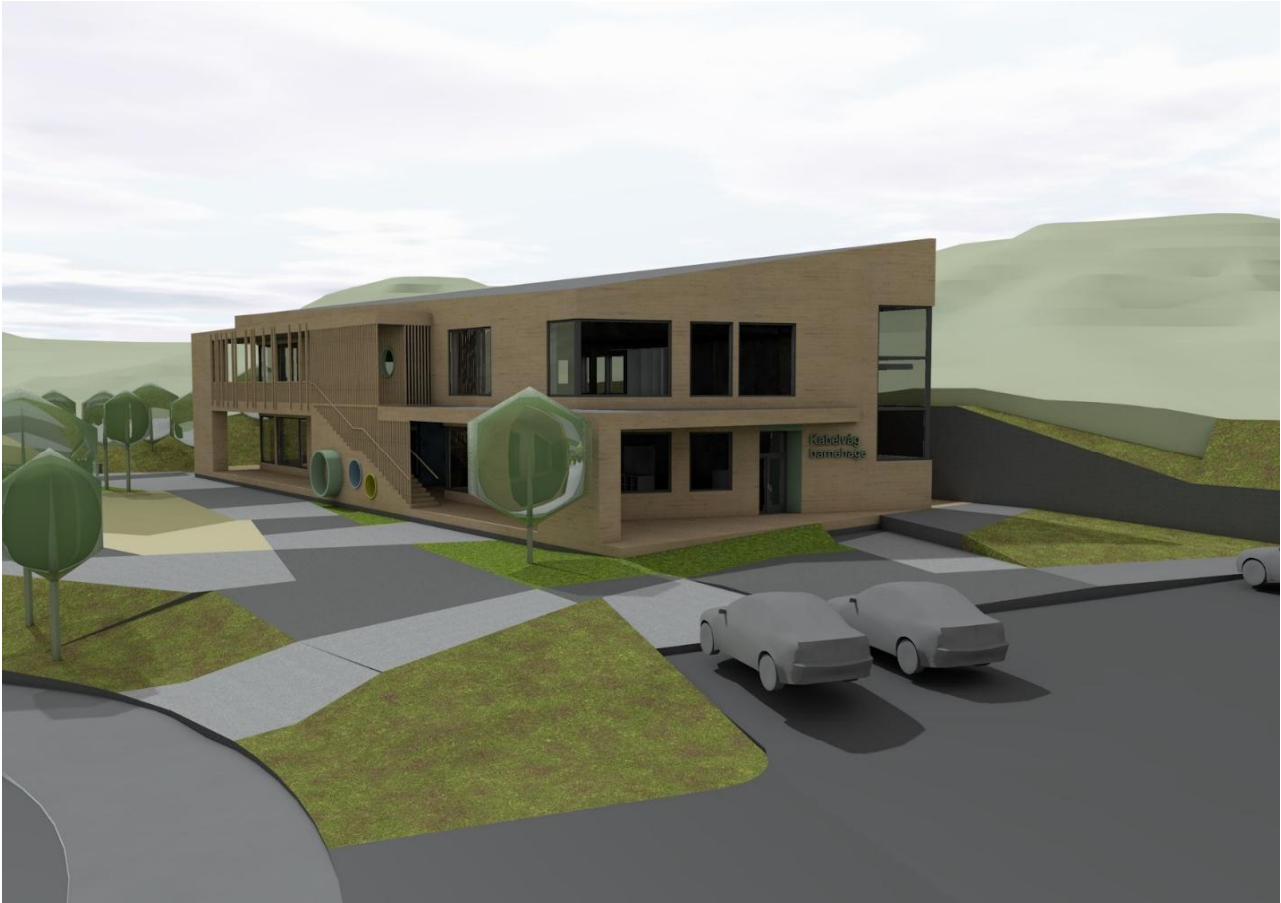
Bygg C - Barnehagen