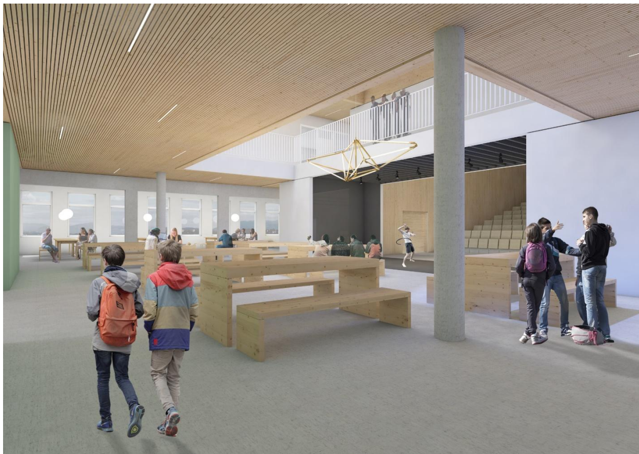
Kantinen i Ungdomsskolen – Bygg A