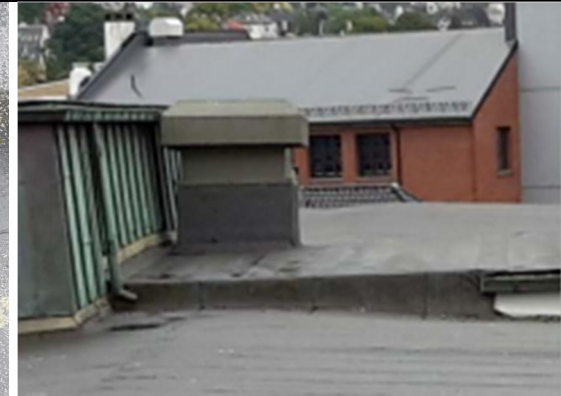
04 Oppbrett og nedbrett, takoppbygg 1 til hovedtak. Oppbrett fra takoppbygg 1 innunder NY båndtekkning og evt. takrenner på takoppbygg 2. VV3 på takoppbygg 1.