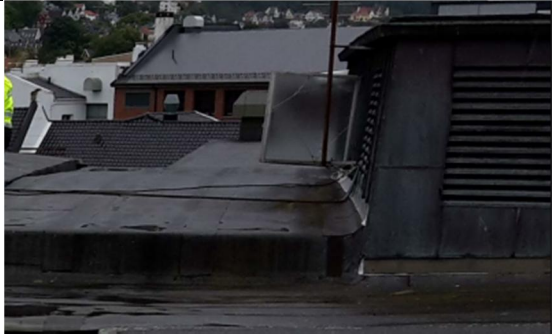
11 Oppbrett fra takoppbygg 3 innunder NY båndtekking på takoppbygg 2.