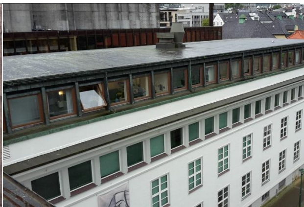
18 Beslag rundt vindu på fasade i 4. etasje