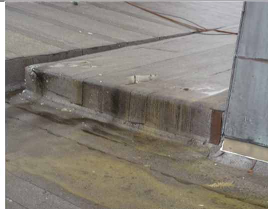
06 Oppbrett og nedbrett takoppbygg 3 til hovedtak. Nedbrett fra nedre del av tårnbygg ned på hovedtak inkl. renne.