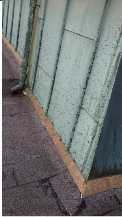
16 Takoppbygg med beslag innunder båndtekking. Beslag rives sammen med båndtekking.