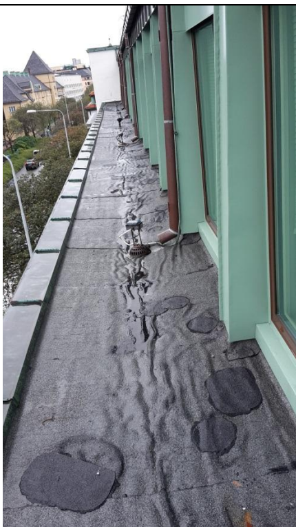
09 Gesims 1, deler av inspeksjonsvei utenfor 4. etasje. Se takplan for lokalisering. Ny oppbrett brettes opp langs vegg for etablering av nye beslag, iht. post. Oppbrett/tekking tekkes innunder nye gesimsbelag