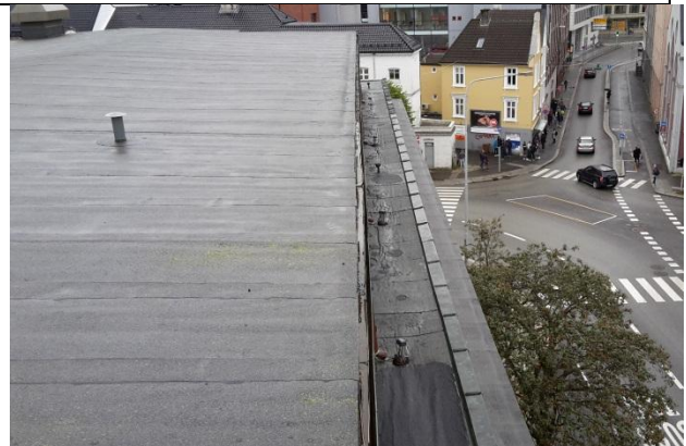
02 Sluk og antatt luftelyre gesims 1, liten takhatt på hovedtak.