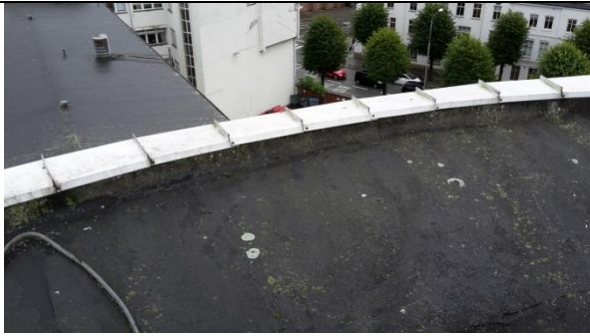
13 Oppbrett/tekking tekkes innunder nye gesimsbelag