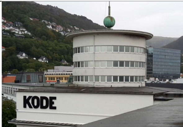
01 Tårnbygg, nedre del, tårn og kuppel. Puss og isolasjon skjæres vekk nede før oppbrett og beslag etableres. Isolasjon og puss reetableres.