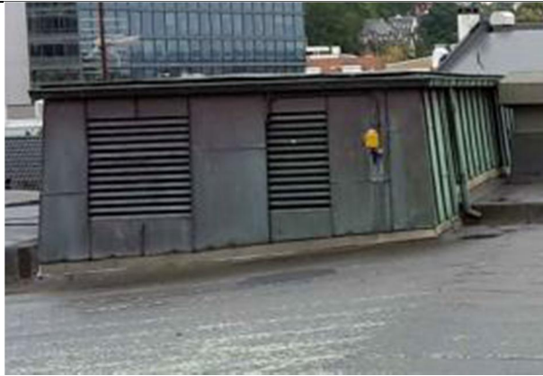
05 Oppbrett innnder NY båndtekking på fasade