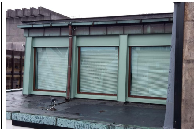
17 Beslag rundt vindu på fasade i 4. etasje