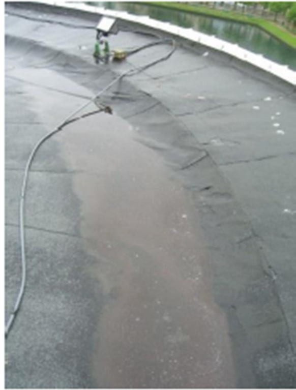
22 Tårnsal, yttertak, feil fall.