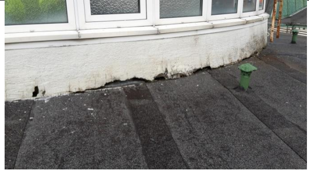
12 Oppbrett takpapp innunder ny isolasjon og puss på tårnbygg