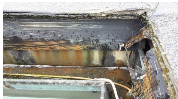
10 Prinsipp eksisterende utførelse på gesims 1 i dag. Tjærepapp skjæres vekk, gamle beslag rives, takrenne rives i den grad det er nødvendig. Ny takrenne, nye belag iht. til detalj. Ny bitumenbasert tekking.