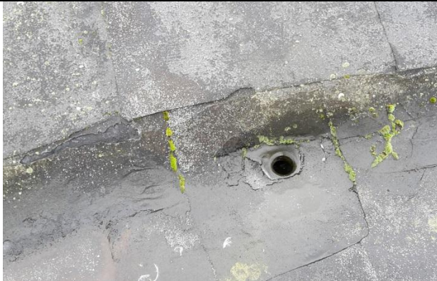
03 Sluk på tårntak