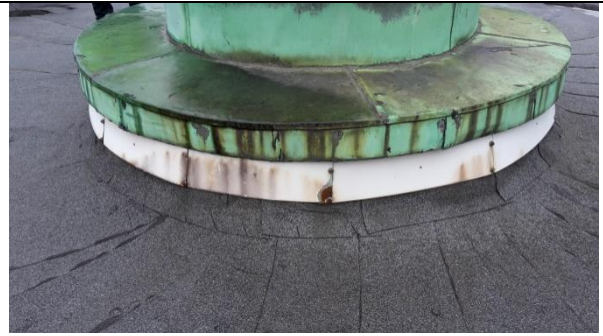
14 Bunn sokkel, gammelt beslag og kopper rives vekk og erstattes med nytt.