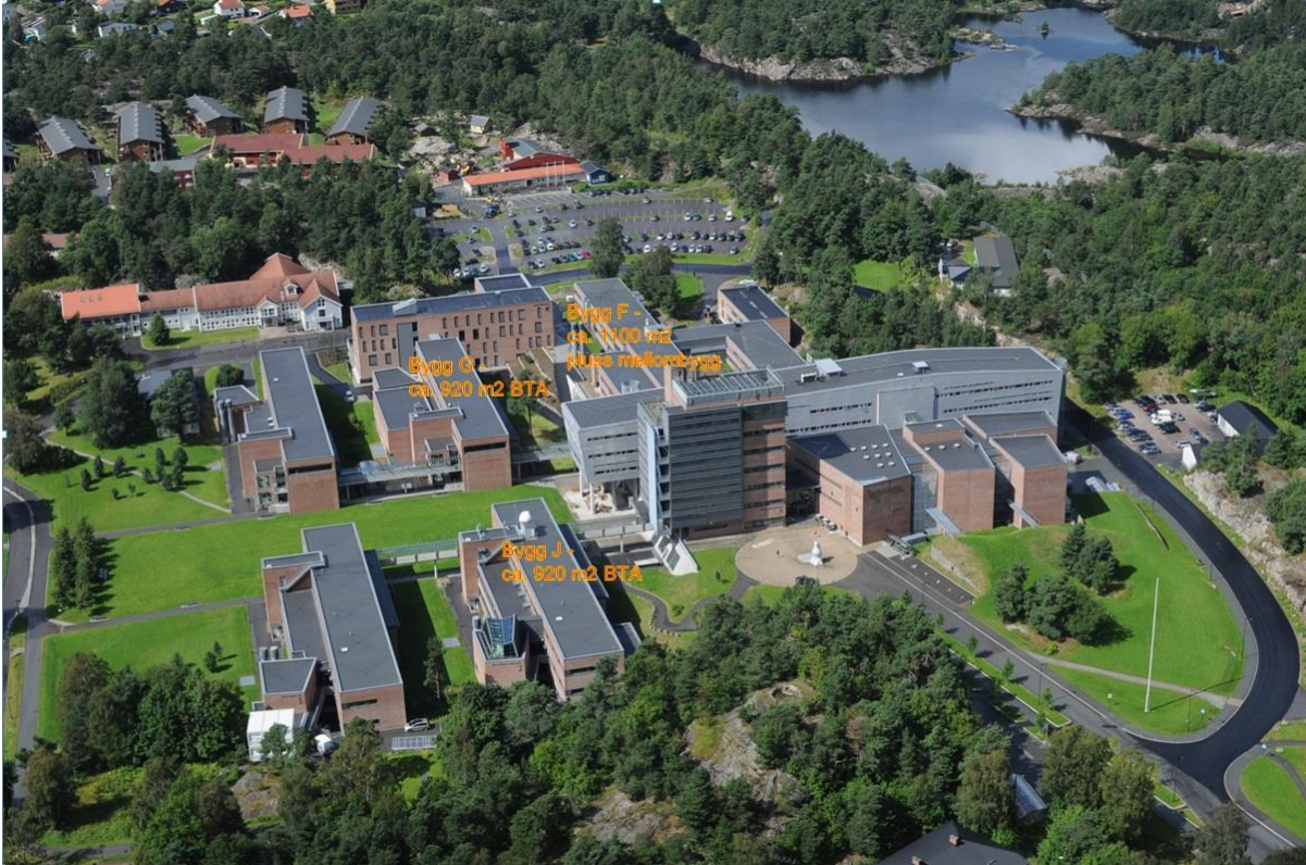
Oversiktsbilde over Campus Gimlemoen.

medarbeidere på drift som kjenner bygget inngående, og som totalentreprenøren må vite å samarbeide med.