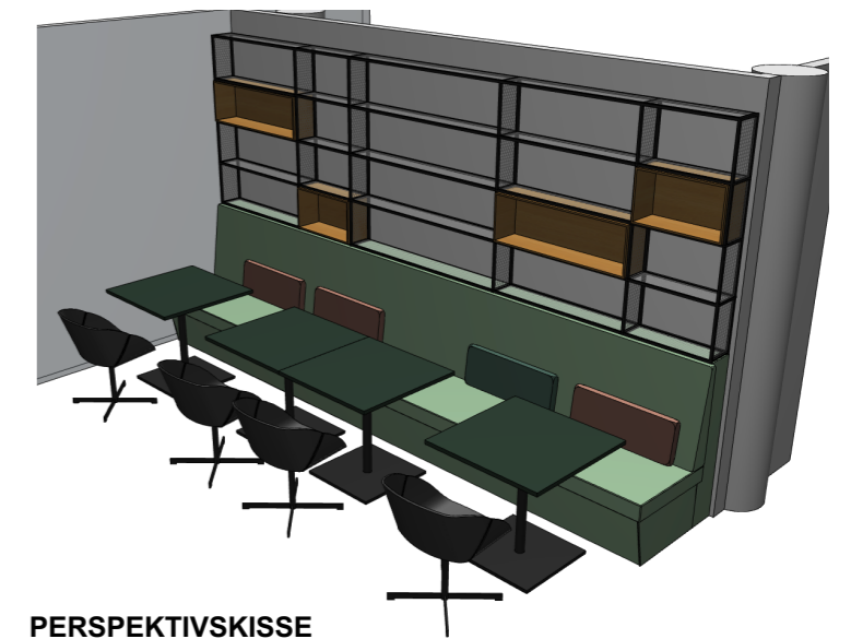
PERSPEKTIVSKISSE HYLLER OG SITTEBENK

NB! Høyde tilsvare høyde på hyller på motstående side i bibliotek (I-713)