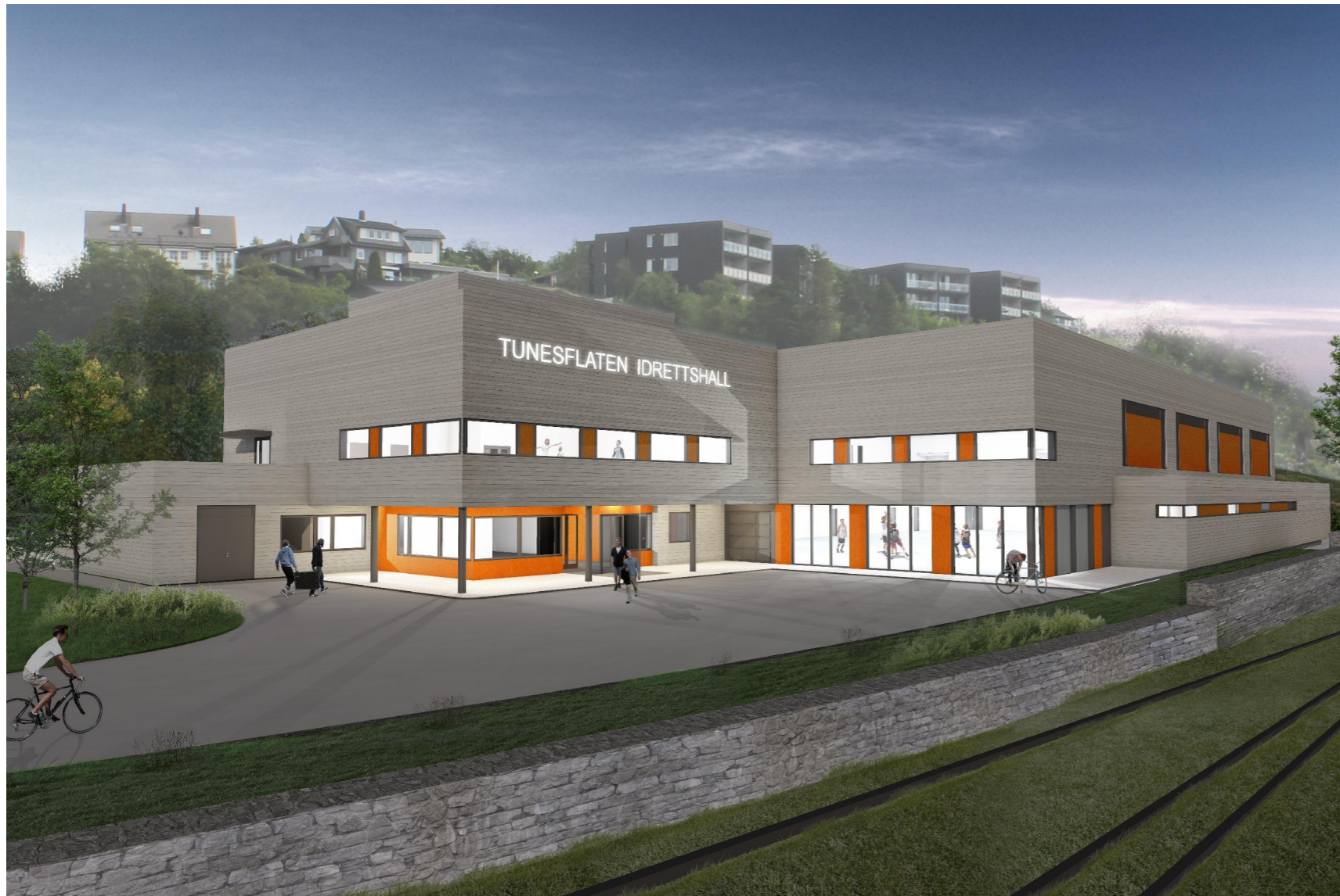
Perspektiv fra Bybanen/Hovedinngang