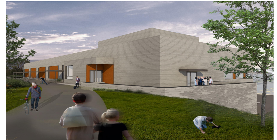
Fra gang- og sykkelveg fra nordvest