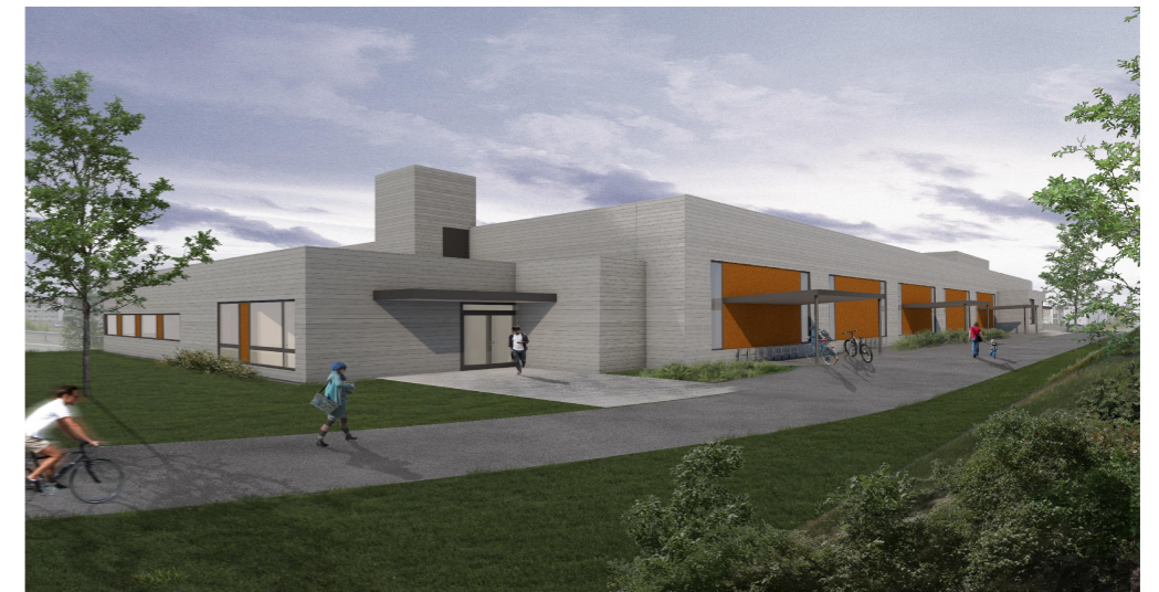
Fra gang- og sykkelveg fra nordøst