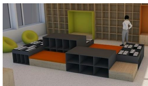
Referansetegning fra Eggen Arkitekter:

Spesiallagd sittebenk (B,C,D): Bygges av kryssfiner (20 mm). Farge: Jotun 9097 Shabby (Transparent beis, gråtone. Som vegg bak møbel)