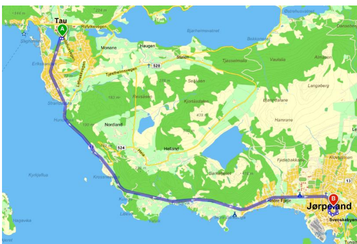
Figur 2: Kjørerute fra lokalt brannvesen til Superparken. ( www.gulesider.no ).

Strand brannvesen består av deltidsmannskap og brannstasjon er lokalisert i Jørpeland sentrum ca. 10 km fra Superparken. Beredskapen forutsettes å være i henhold til Forskrift om dimensjonering av brannvesen . Møte med brannvesen ved brannsjef Asgeir Gjerde er gjennomført 2016-12-14, deltagende var brannsjef, RIVA, LARK og RIBr.