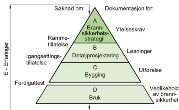
Figur 3: Figur 01 fra Byggforsk blad 321.026.

Dokumentasjonen i denne rapporten er en overordnet beskrivelse (nivå A) som angitt i Sintef Byggforsk blad 321.026 Brannsikkerhet. Dokumentasjon av brannsikkerhetsstrategi . Prinsipper for oppbygning av brandokumentasjon er vist i Figur 3.