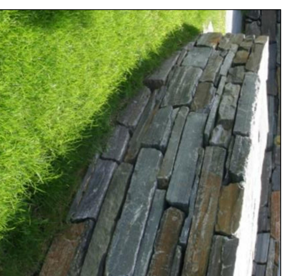
TØRRMUR TOSIDIG - SNITT M 1:20