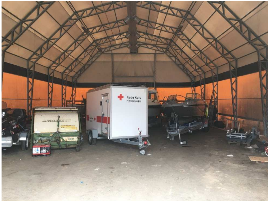
Bilde 6: Innvendig plasthall