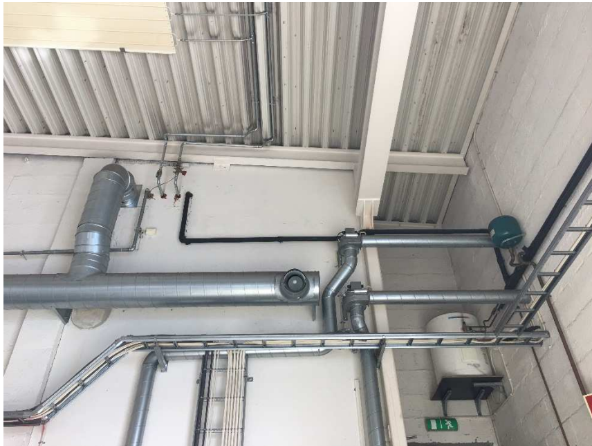
Bilde 3: Vvs Utstyr