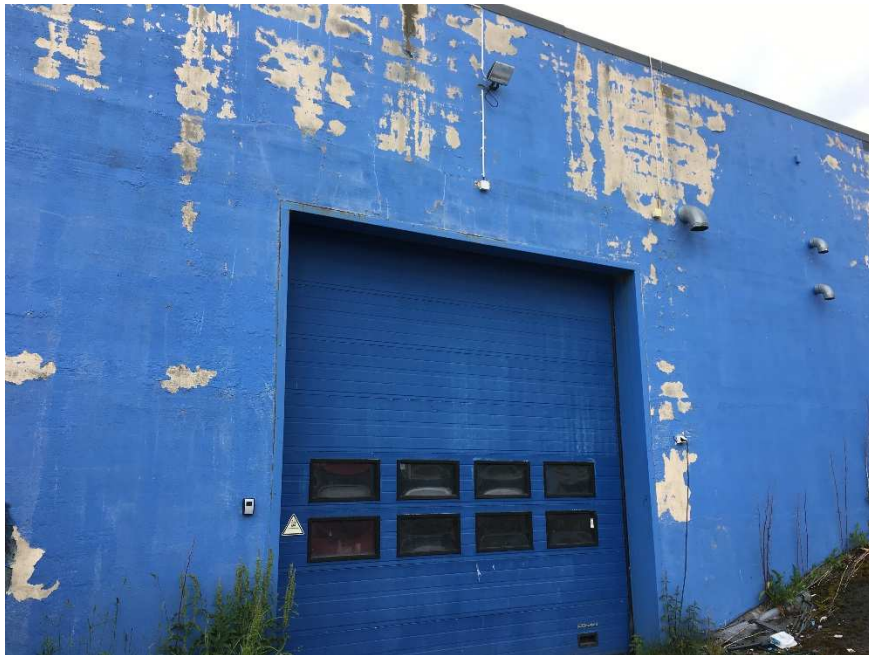
Bilde 1: Verkstedhall med port