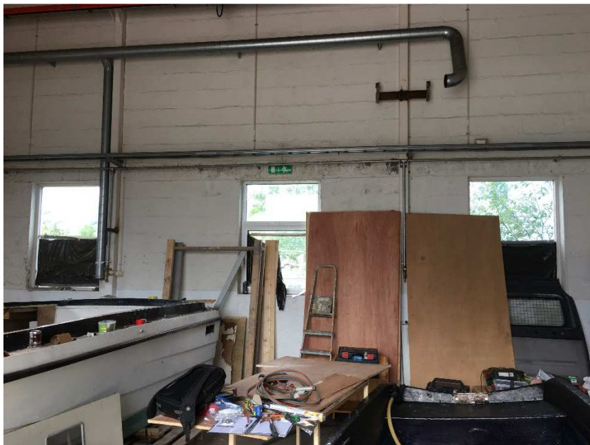
Bilde 4: Vinduer