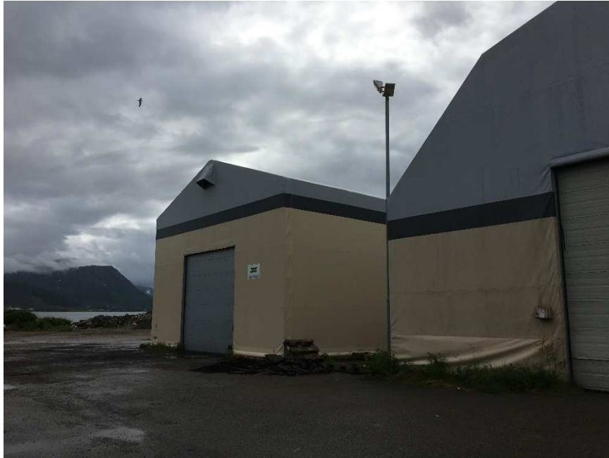
Bilde 5: Plasthaller som skal demonteres