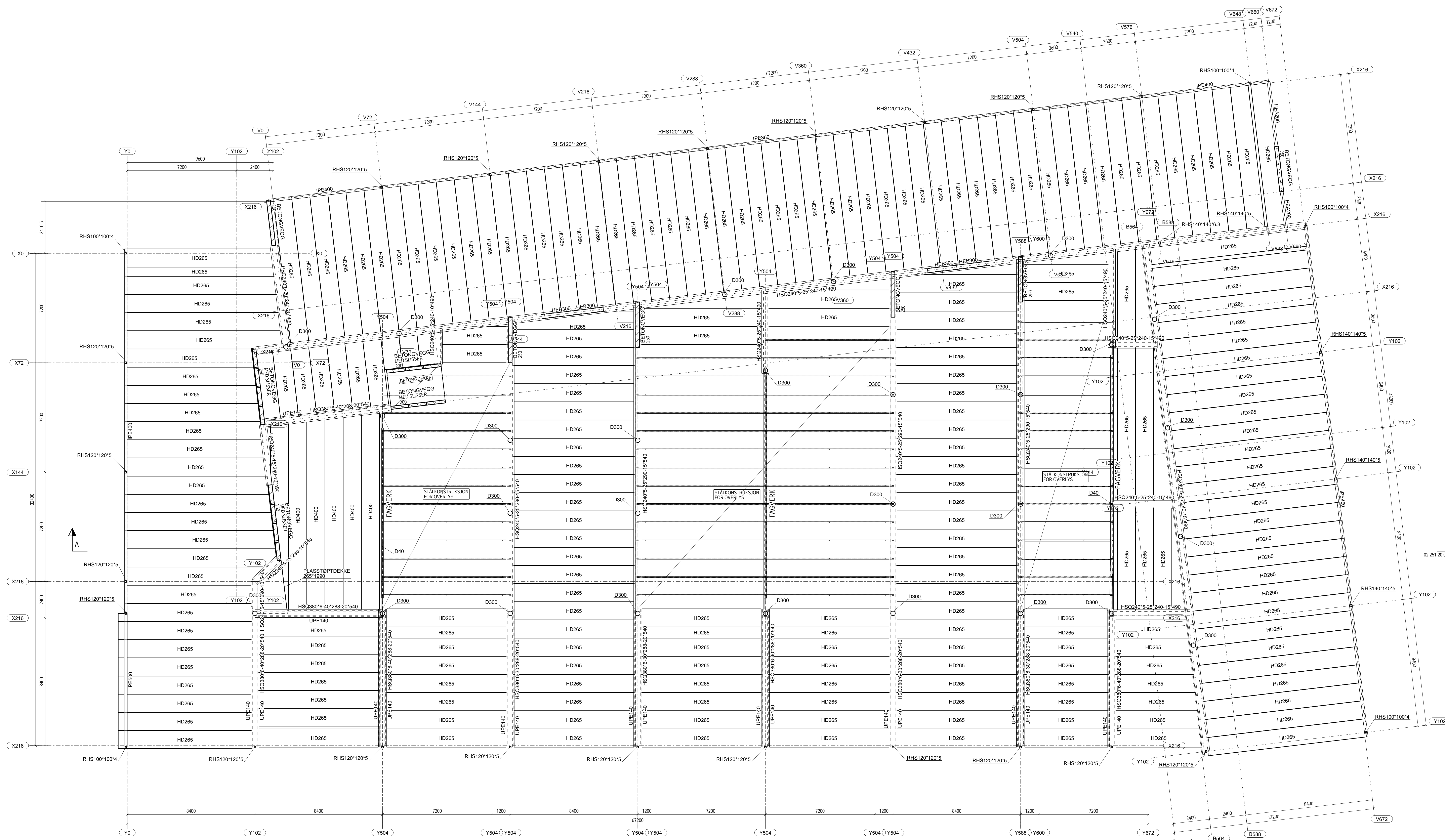
DEKKE OVER PLAN 02