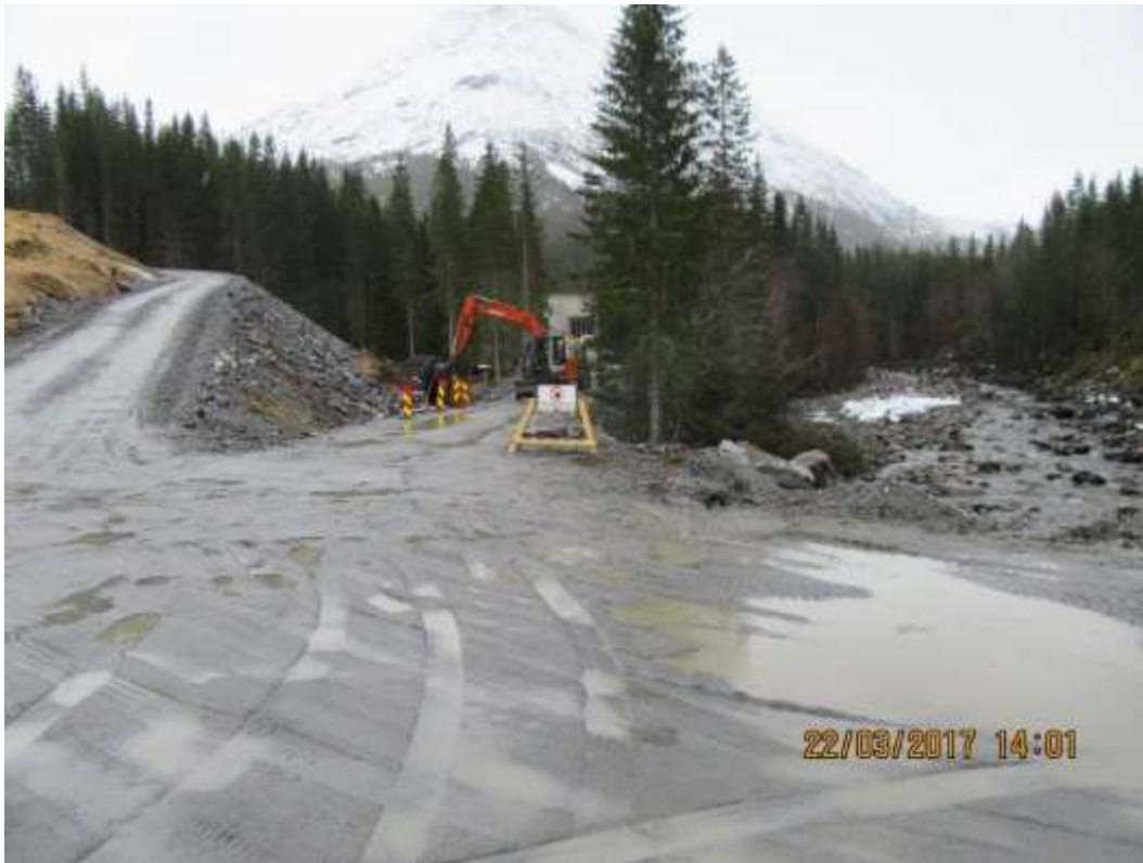
Figur 15: Adkomstveg Tverråa kraftstasjon og portal Tverråa