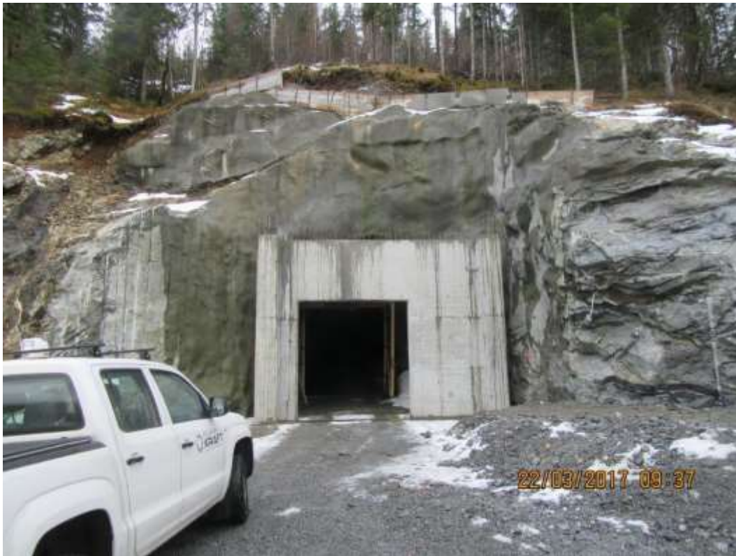
Figur 5: Portal Leiråa