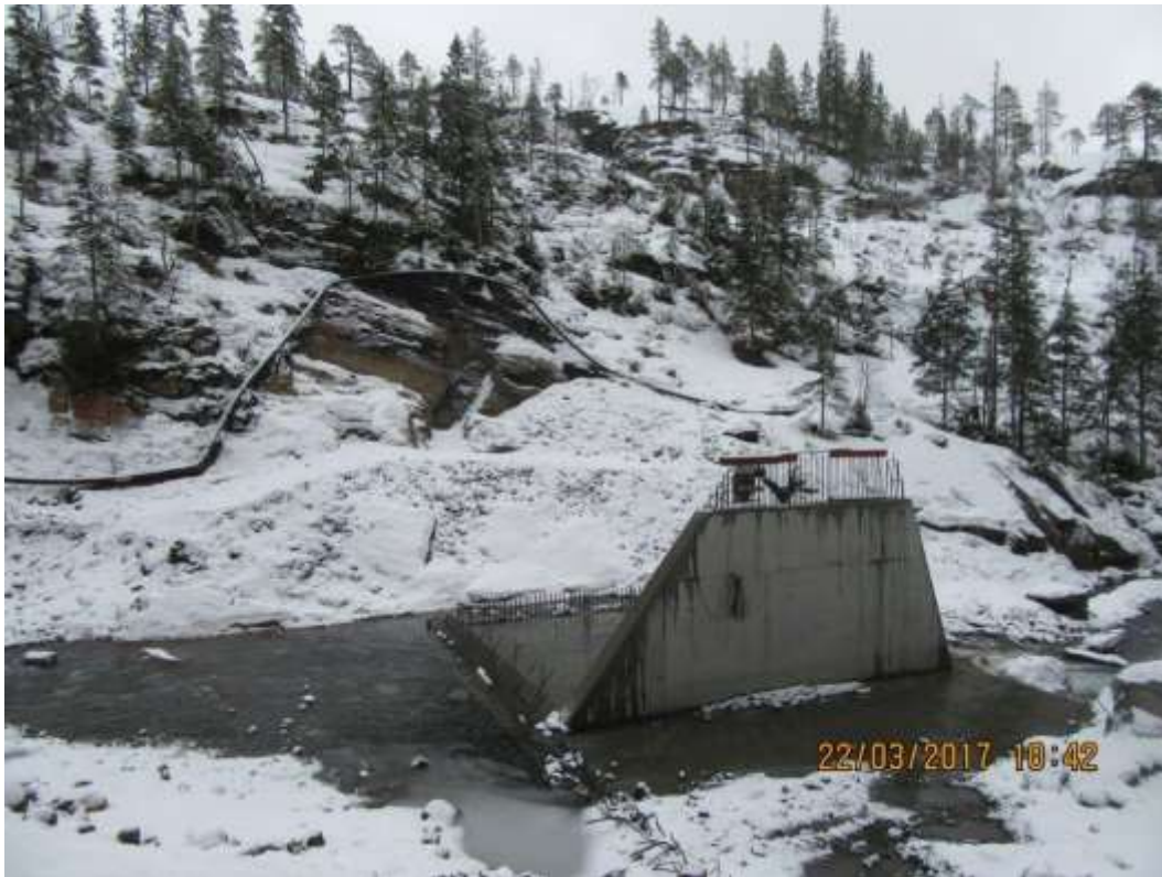
Figur 11 Dam Tverråa: Fundament og midlertidig vannledning