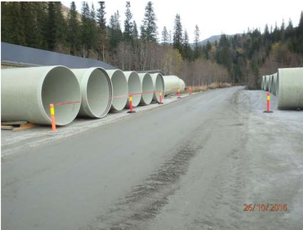
Figur 26: Rørlager