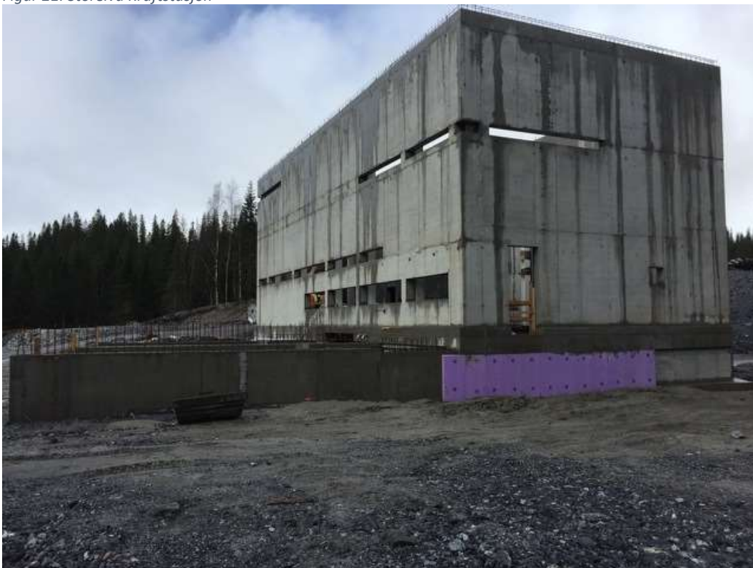
Figur 22: Storelva Kraftstasjon