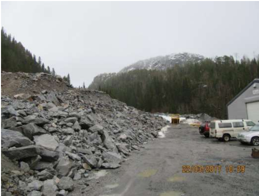
Figur 9: Massedeponi Bjørnstokk