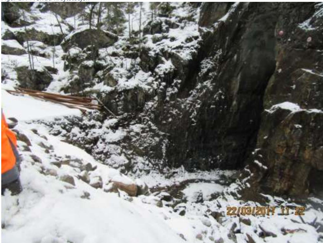
Figur 18: Kromåa bekkeinntak