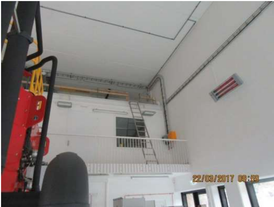
Figur 7: Mesanin Leiråa hvor rekkverk skal monteres