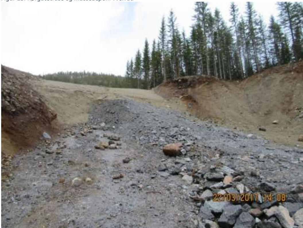
Figur 14: Rørgatetrase Tverråa