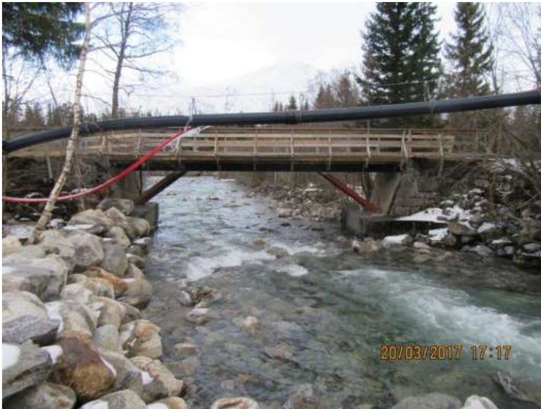
Figur 3: Leiråa bru som skal utbedres noe