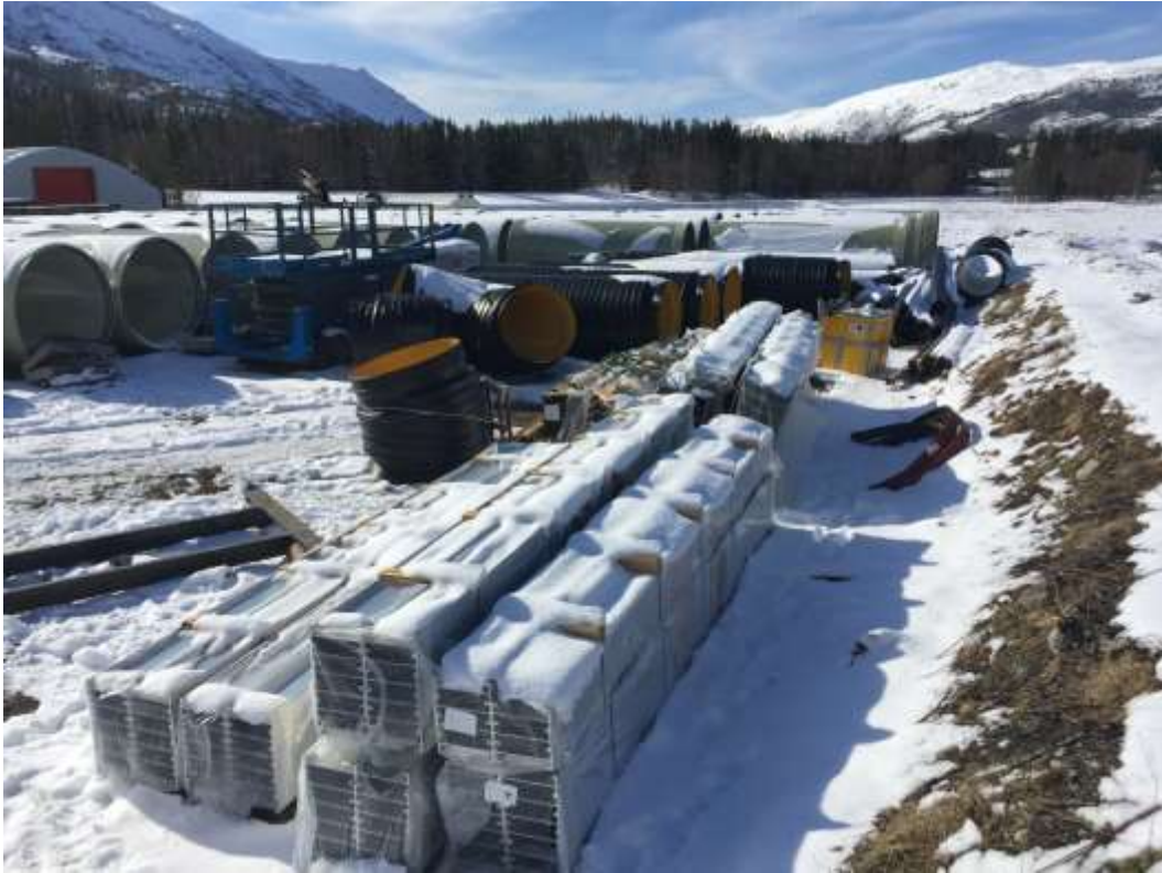
Figur 25: Diverse materiell fra byggherre