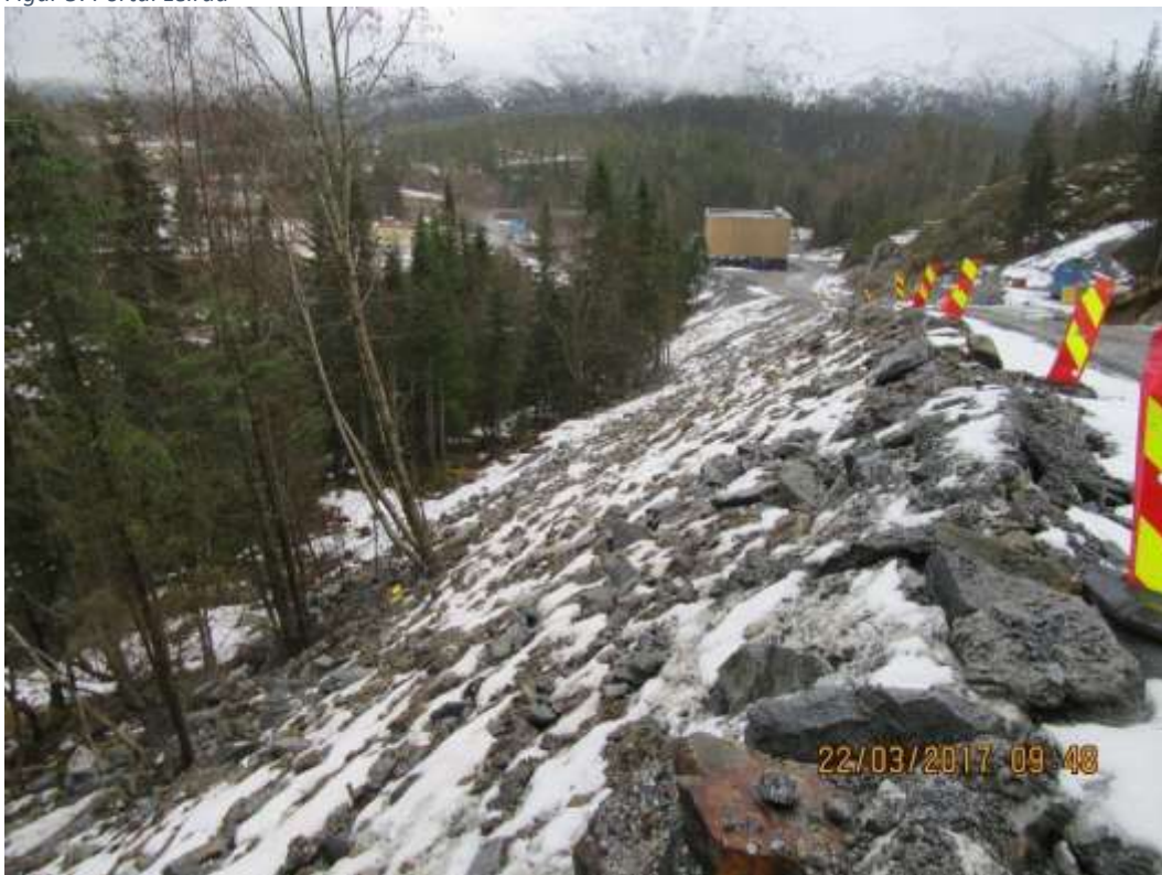
Figur 6: Massedeponi/Utenomhus Leiråa