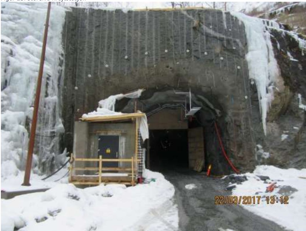
Figur 24: Portal Tosdalen Kraftstasjon