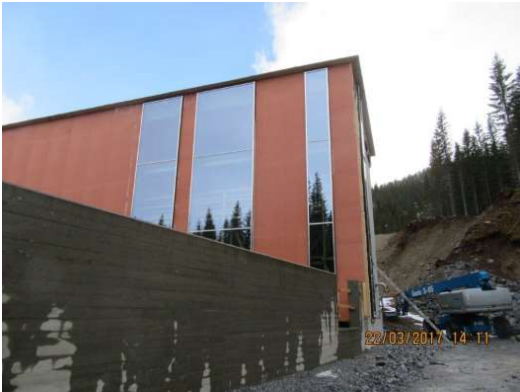
Figur 17: Tverråa Kraftstasjon