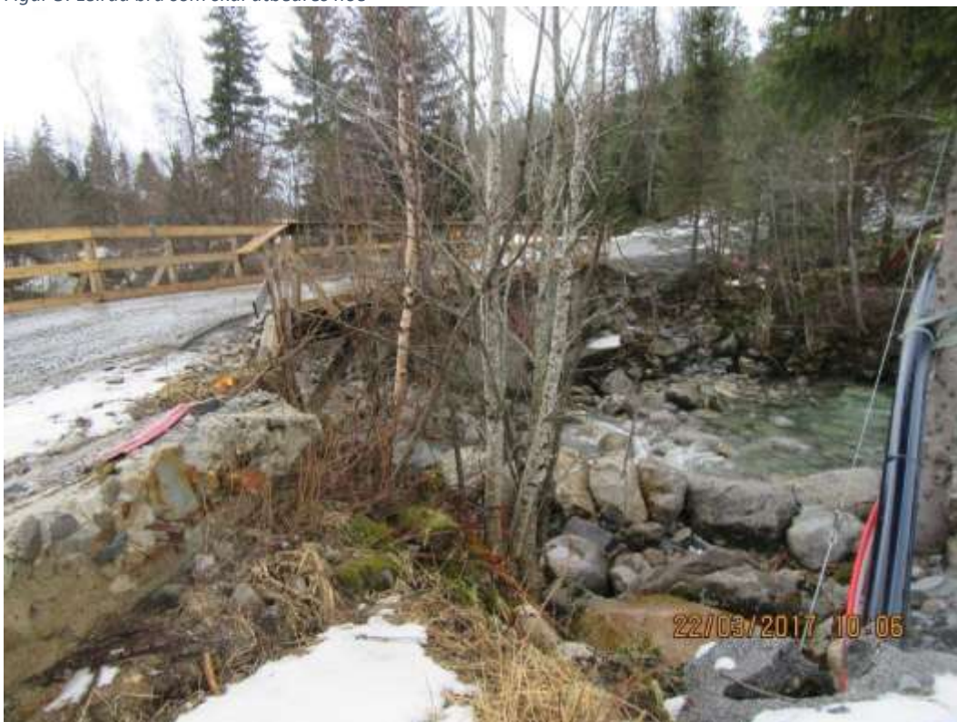
Figur 4: Leiråa bru og kabler som skal henges opp under bru