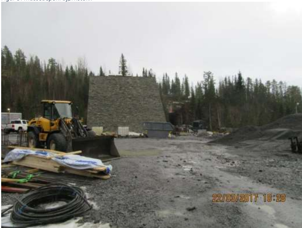
Figur 10: Utenomhus Bjørnstokk Kraftstasjon