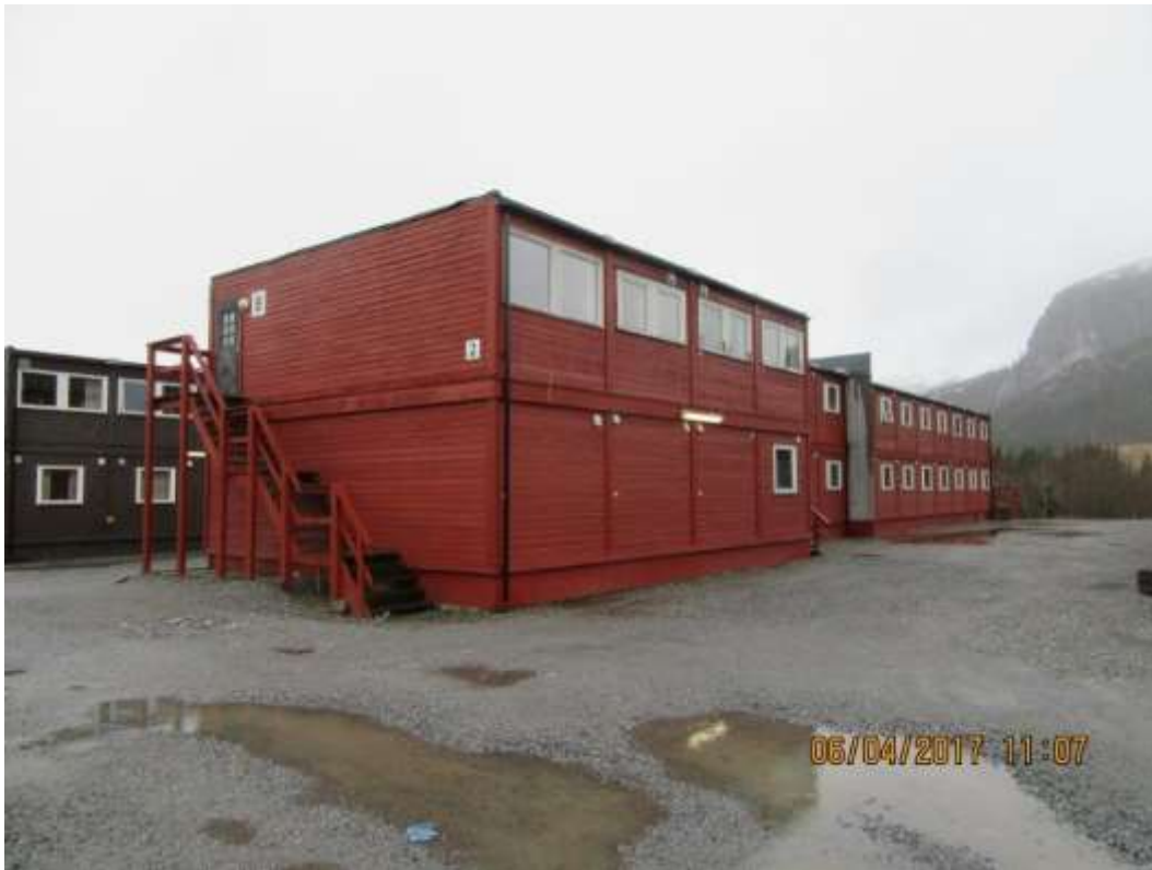
Figur 1: Brakkerigg disponibel for ENT