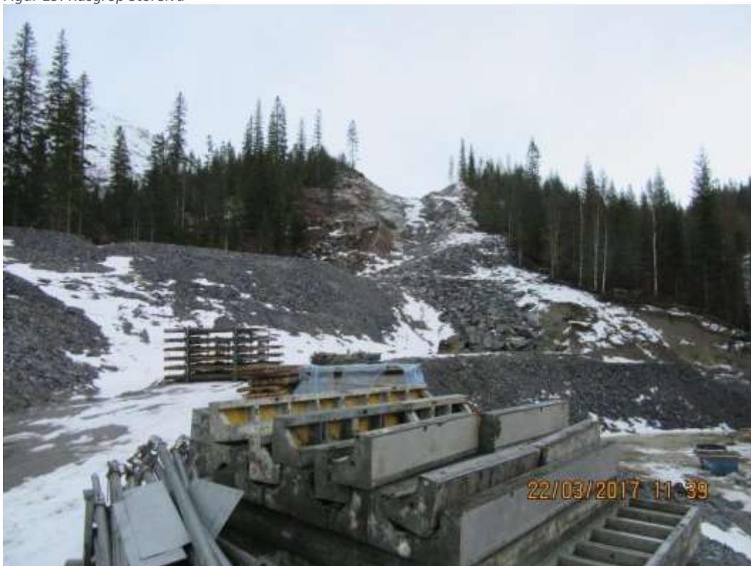
Figur 20: Deler av rørgatetråse Storelva