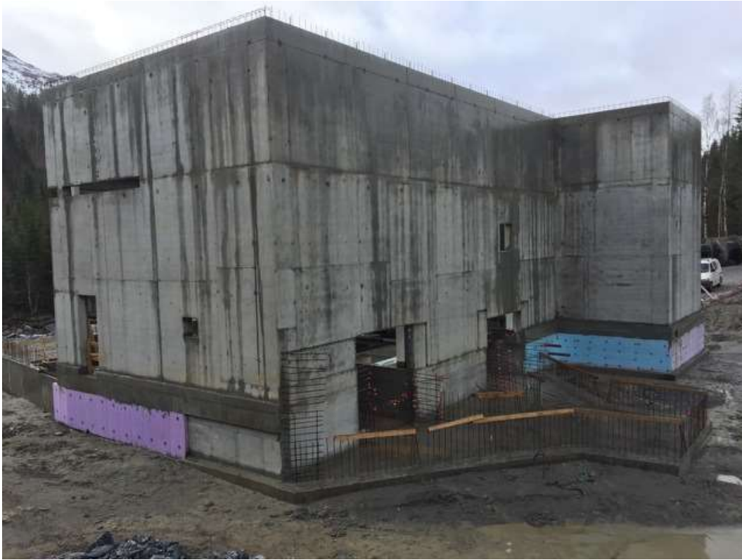
Figur 23: Storelva Kraftstasjon