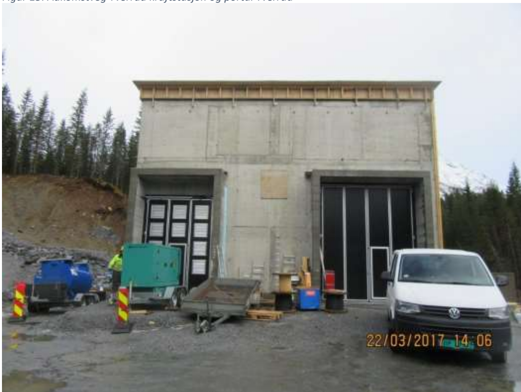
Figur 16: Tverråa Kraftstasjon