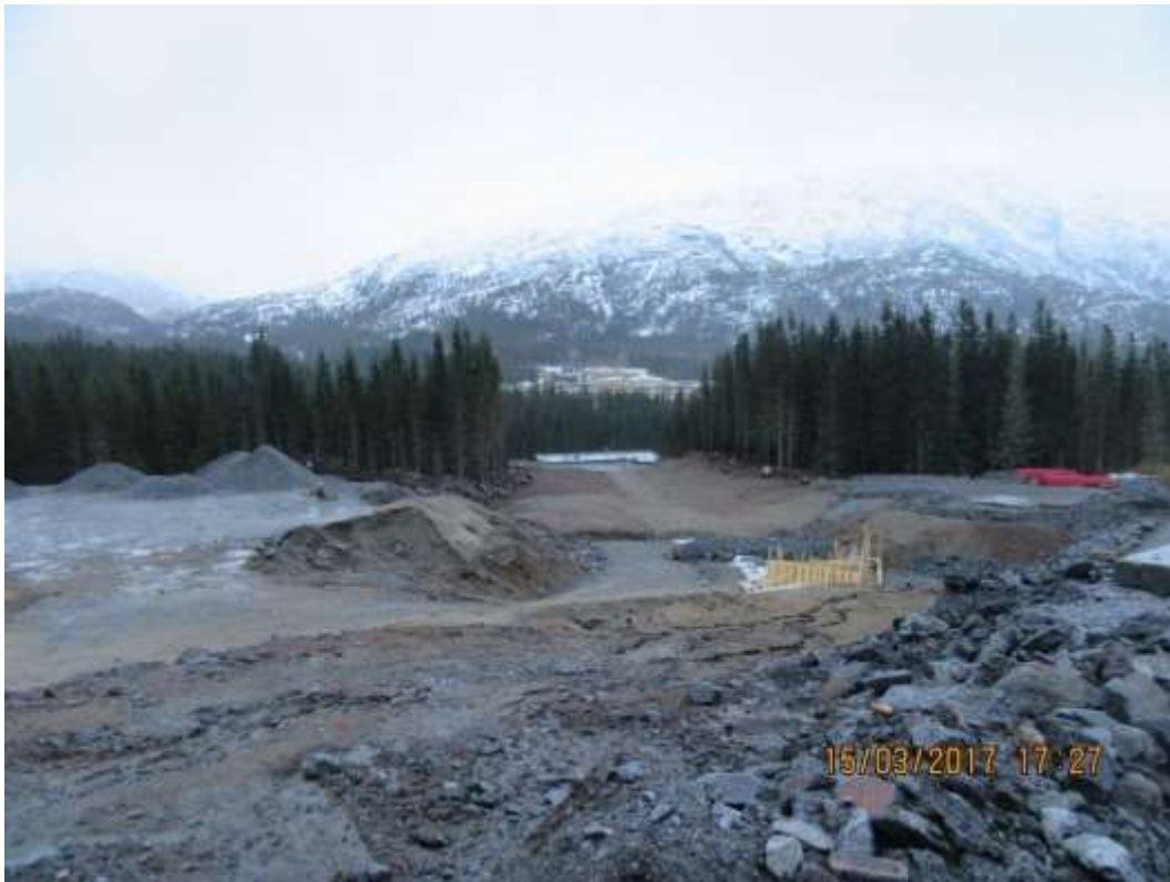
Figur 13: Rørgatetrase og massedeponi Tverråa