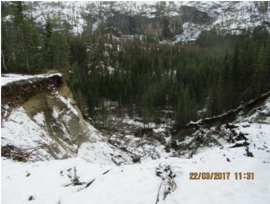
Figur 19: Rasgrop Storelva