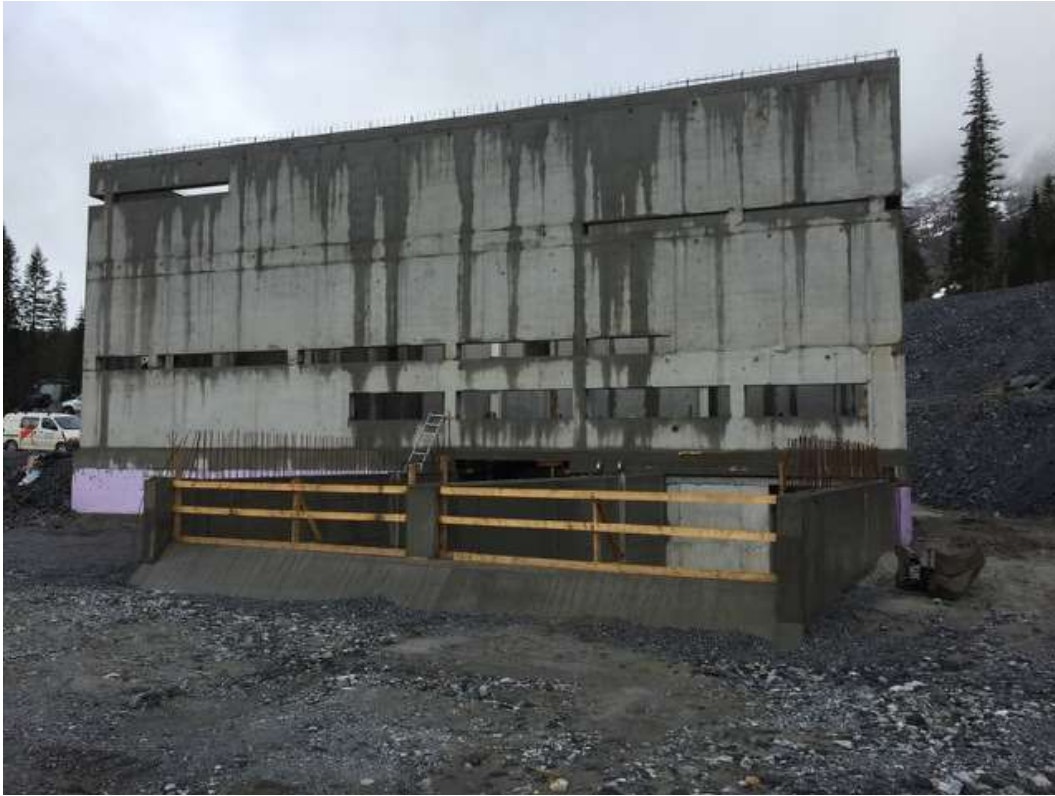
Figur 21: Storelva Kraftstasjon