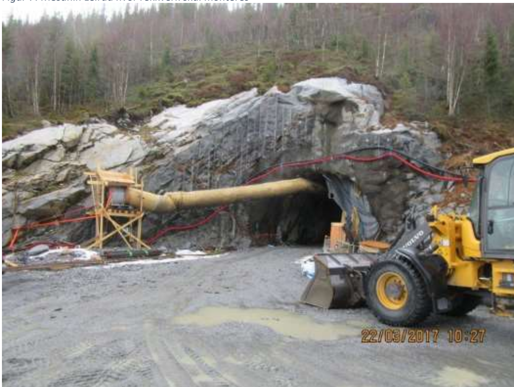
Figur 8: Portal Bjørnstokk