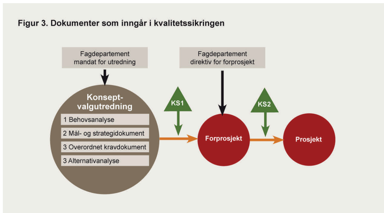
Figur 3. Dokumenter som inngår i kvalitetssikringen