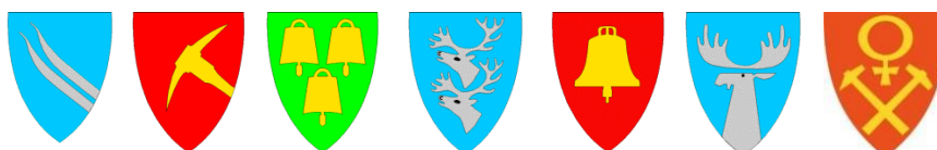
Alvdal Folldal Os Rendalen Tolga Tynset Røros