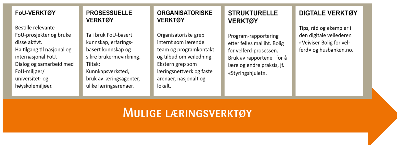
Figur 2: Mulige læringsverktøy

alle kommuner, brukere og øvrige samarbeidspartnere.