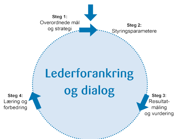
Figur 3: Styringshjulet

Rapportering fra Kommuneprogrammet ses i sin helhet i sammenheng med de mål- og resultatstyringskrav som er utarbeidet som en oppfølging av «Bolig for velferd», jf. styringshjulet i figur 3 nedenfor 19 .