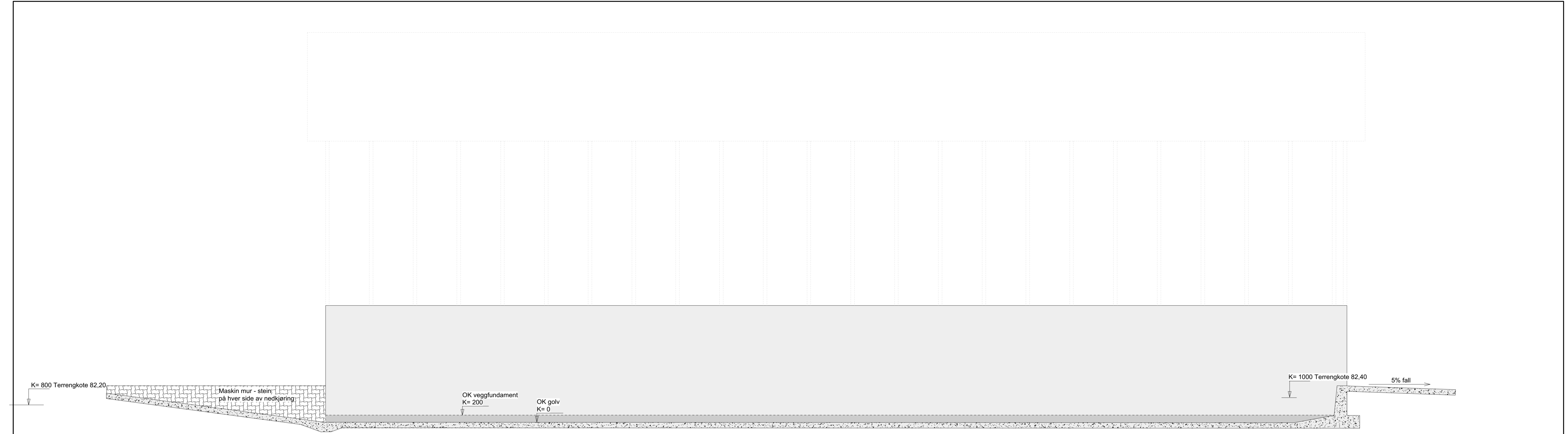
SNITT B-B, MALESTOKK 1:50