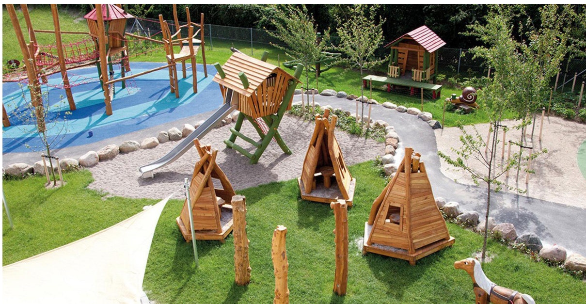
Bilde: Lite lekehus med 3D klatresystem i midten, 3+ år (lek 16)