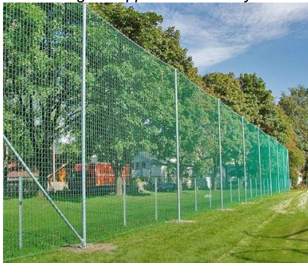
Bilde: Fangnett oppføres i 5 m høyde

Grusbanen som ligger på området vestside som avgrenses av Tareveien og Torsketrøa skal opparbeides med nytt grusdekke og fangnett. Det skal også tilrettelegges for ballbinge og fremtidig lekeområder langs Tareveien. Mot vei skal det leveres fangnett også her.