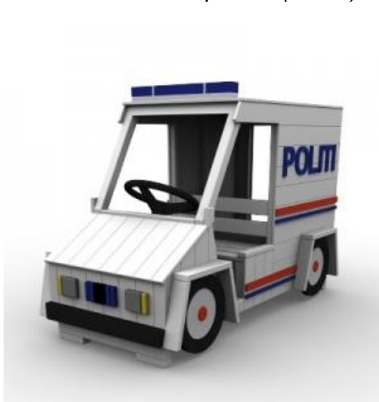
Bilde: Eks. utelek – politibil (lek 18)