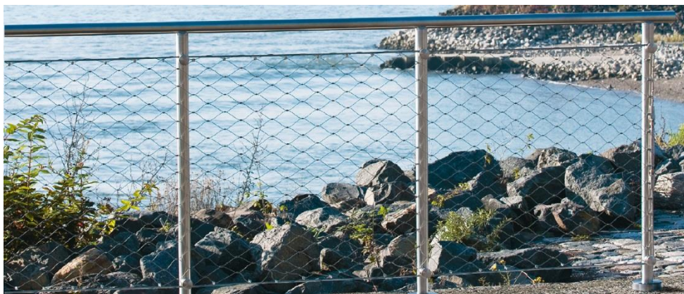
Bilde referanse rekkverk: Q-Line Easy q-web

Pris for gjerder og porter føres i Prisskjema Vedlegg F 06.02 Lekeapparater og utstyr Enhetspris for gjerde skal kunne benyttes for justering av mengder. Medtatt løpemeter for gjerde samt størrelse og antall for porter i hht oppsett i prisskjema.