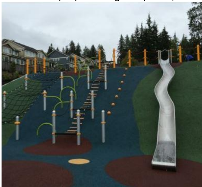
Bilde: Eksempel på terrengsklie (lek 14)

I skråning som avmerket på tomteplan skal det leveres en samling av terrengsklie, klatrenett på stolper, klatretau (festet i begge ender) og «trapp» Apparatenes skal leveres med underlag av gummi-asfalt.