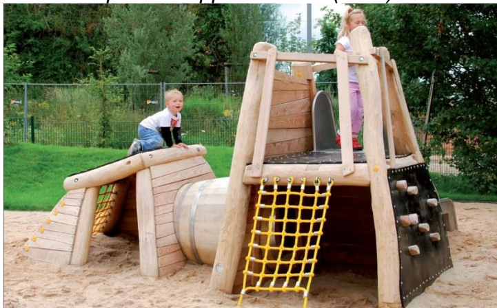
Bilde: Uniqa Klatreapparat 1-3 år (lek 1)

Det skal gis stk pris på alle lekeapparater og møbleringer som følger med eksempelbilder/beskrivelse i vedlegg. Alle apparatene skal prises komplett og ferdig montert inkludert eventuelle fundamenter. Oppgitte priser skal kunne benyttes som grunnlag for justering av mengder samt uttrekk dersom objektet i sin helhet utgår.