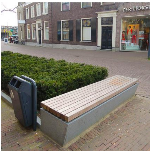
Bilde fra Streetlife: Referanse Plassbygget benk med Sitteplank

Sitte 2 – ca 900 cm lengde (sentermål) bredde ca 90 cm