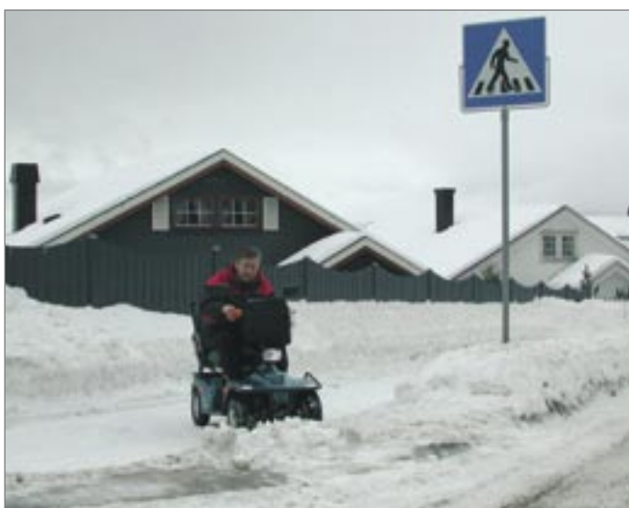
Gode drifts- og vedlikeholdsrutiner har stor betydning for framkommeligheten både vinter og sommer.

Universell utforming omfatter planlegging, bygging, drift og forvaltning av bygninger, anlegg og uteområder, tjenesteproduksjon og service, salg av produkter og bruk av elektronisk informasjons- og kommunikasjonsteknologi.