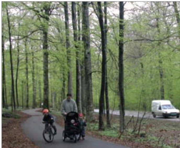
Mulighet for å benytte natur og friluftsområder er viktig for helse og rekreasjon. Begge aspektene berøres av satsinger i handlingsplanen.

Deltasenteret arbeider med hvordan bruk av hjelpemidler og tilrettelegging av miljø sammen bidrar til å bedre tilværelsen for mennesker med funksjonsbegrensninger. Deltasenteret har konsentrert innsatsen rundt sentrale områder som transport, bygninger og uteområder, informasjons- og kommunikasjonsteknologi og opplæring og arbeid. Senteret vil få en sentral plass i gjennomføring av tiltak i handlingsplanen i samråd med Miljøverndepartementet og Arbeids- og sosialdepartementet. Senteret vil bli brukt i forbindelse med rullering og revisjon av handlingsplanen.