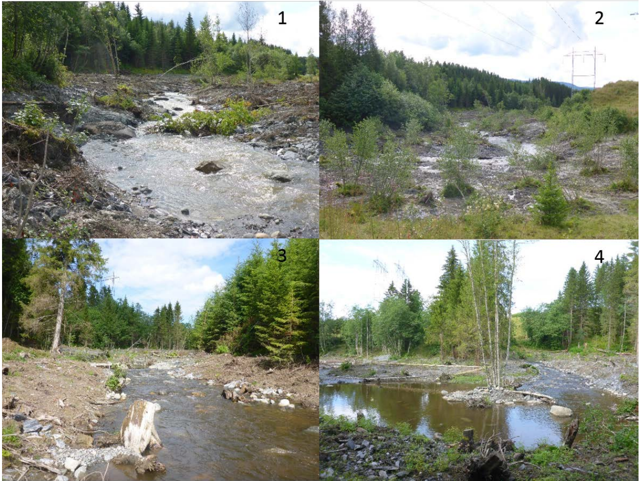
Figur 2 Bilder tatt etter endt sikringsarbeid i august 2015. Bildene refererer til tallene på kartet i figur 1.