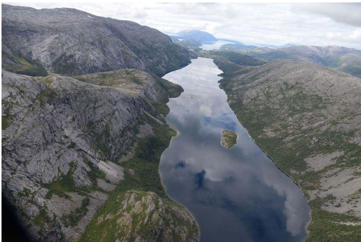
Bilde 6 Utsikt fra helikopter fra Vassenden over til vestsiden av Storvatnet