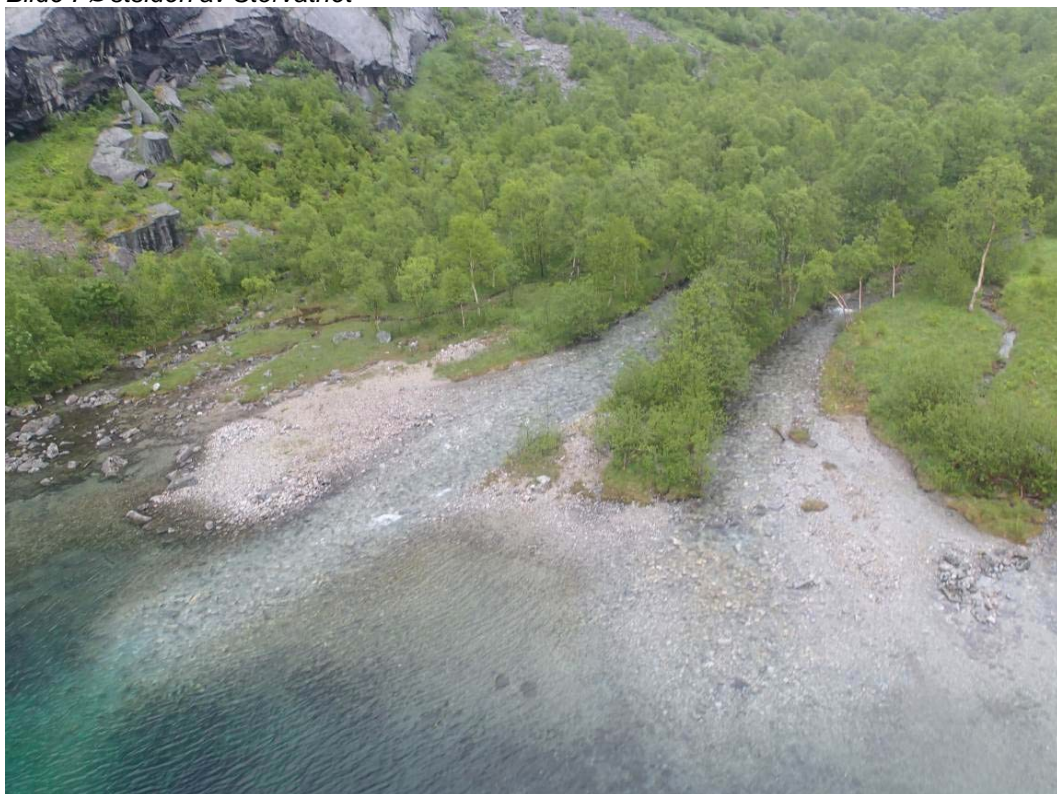
Bilde 8 Kaiområde på østsiden av Storvatnet