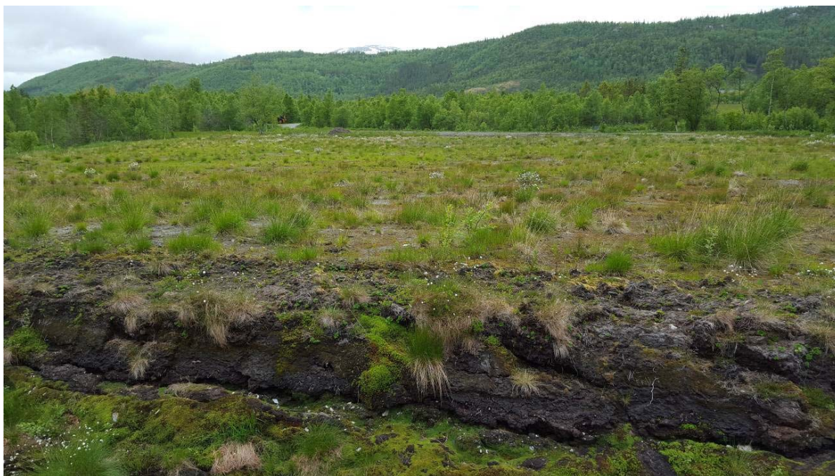
Bilde 2 Planlagt rigg- og lagerområde