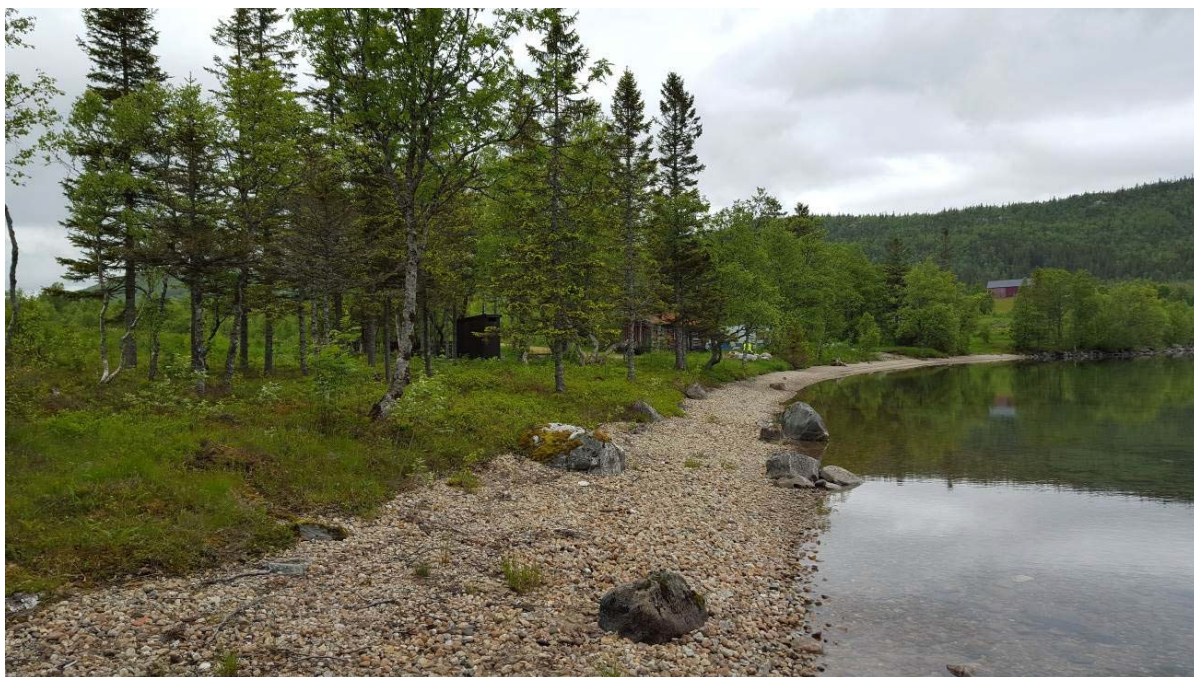
Bilde 5 Område for kaianlegg på vestsiden av Storvatnet