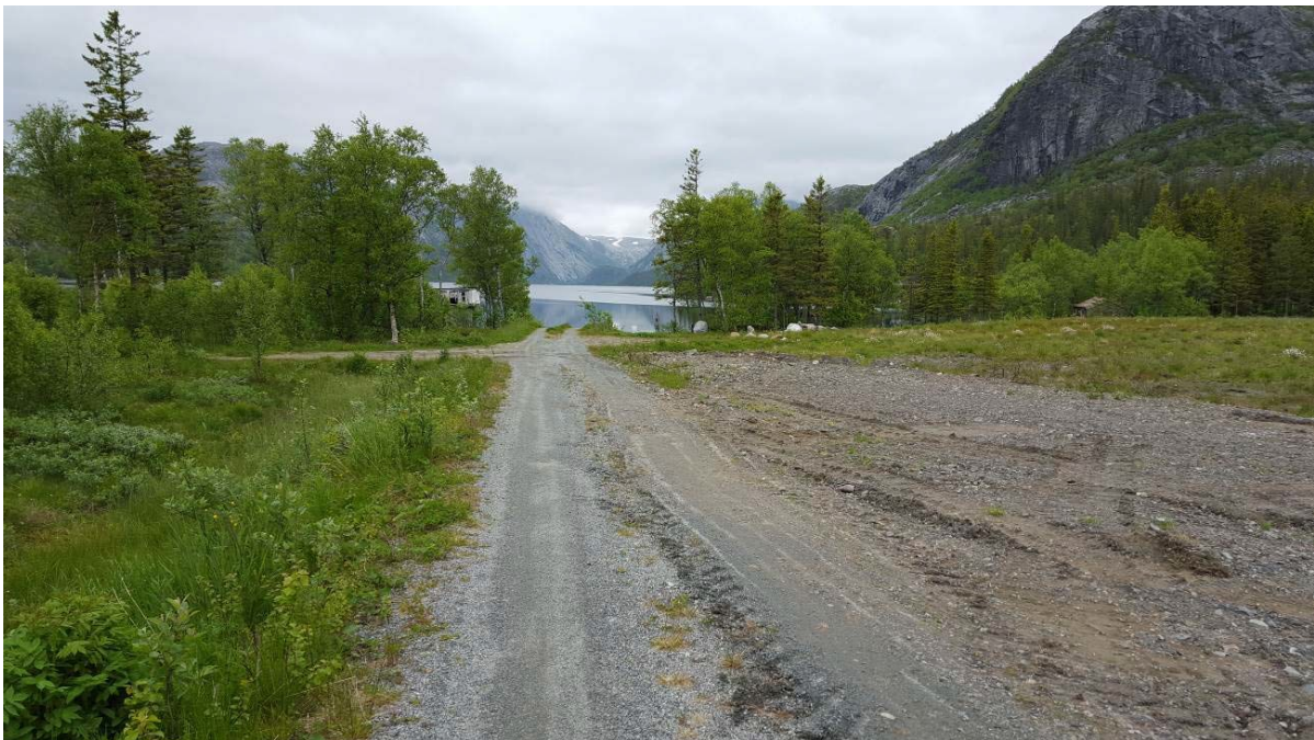
Bilde 4 Planlagt rigg- og lagerområde, med utsikt mot Vassenden