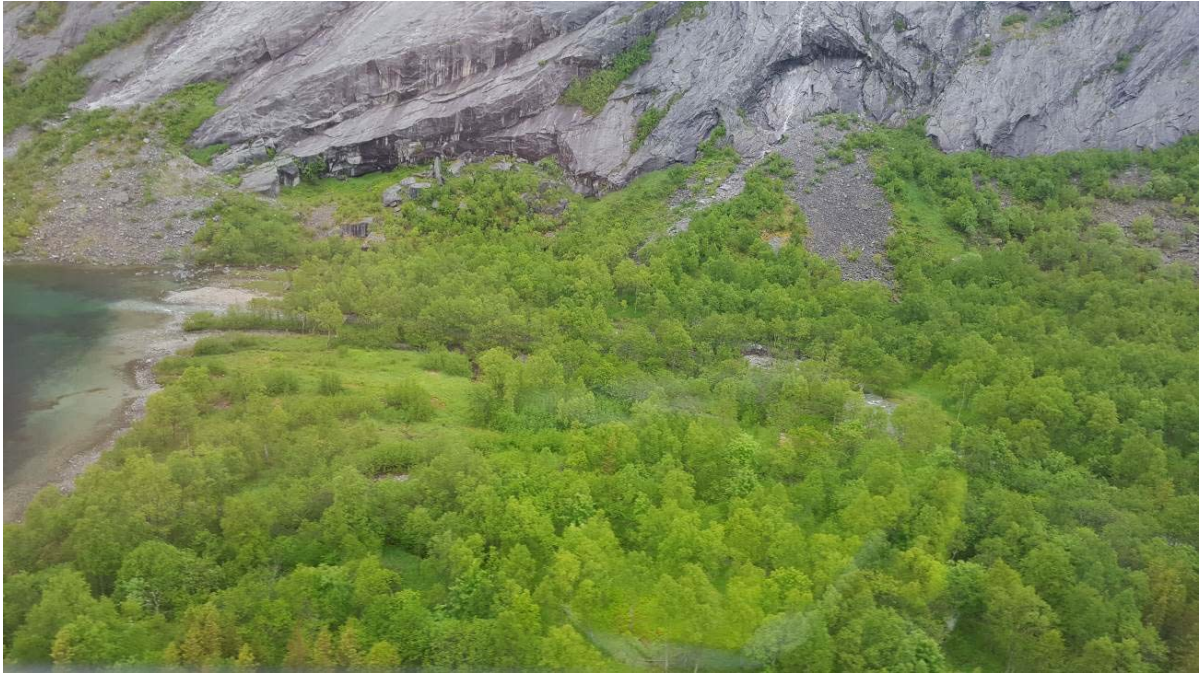
Bilde 9 Området fra kaiområdet og oppover, rasvoll planlagt mot fjellsiden