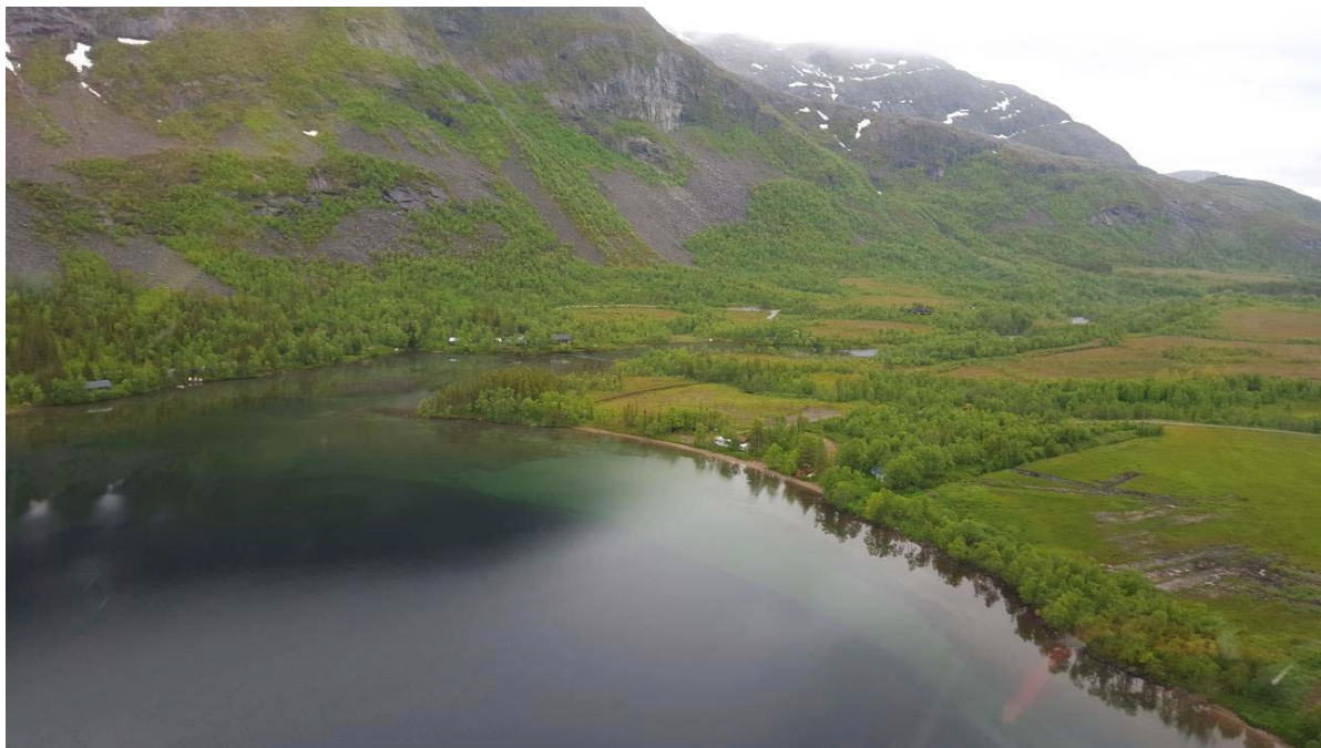
Bilde 1 Oversikt mot riggområde på vestsiden av Storvatnet