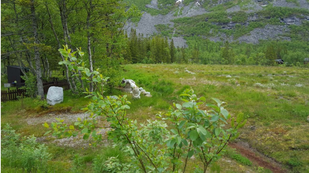
Bilde 3 Planlagt rigg- og lagerområde