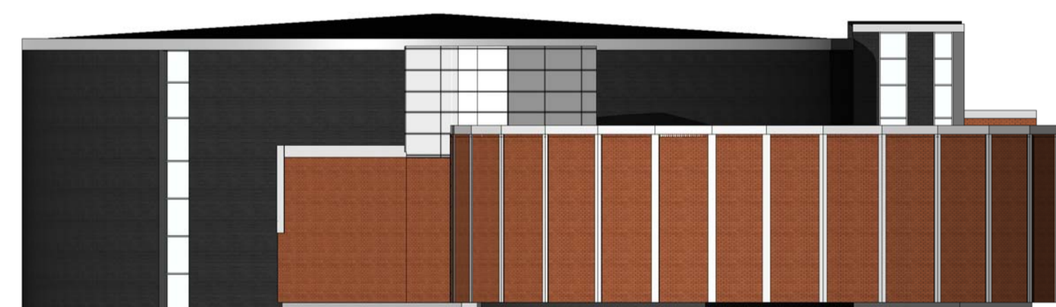
Øst - Rammesøknad 1 : 200

Tegningsnummer: AF 00 001 Revisjon: G-01