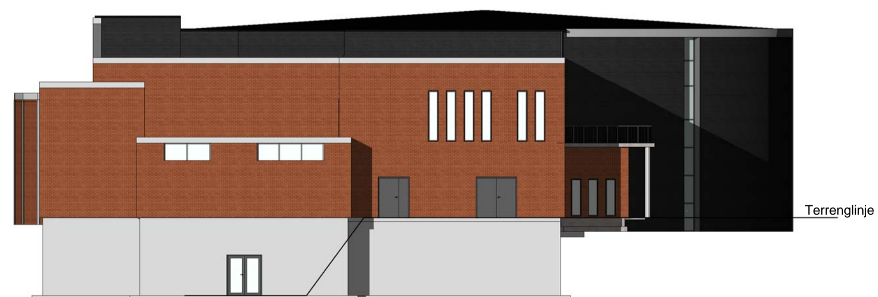
Vest - Rammesøknad 1 : 200