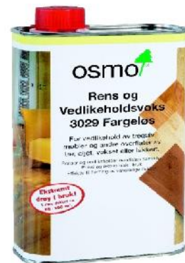
3029/3087 Rens- og Vedl.voks.