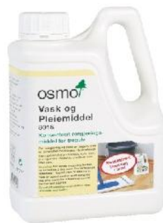
8016 Vask- og Pleiemiddel