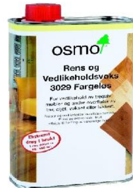
3029/3087 Rens- og Vedl.voks.