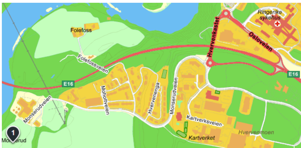
Kart 1: Adkomst til Monserud Renseanlegg.

Monserud renseanlegg er lokalisert ved E16 rett utenfor Hønefoss i Ringerike kommune.