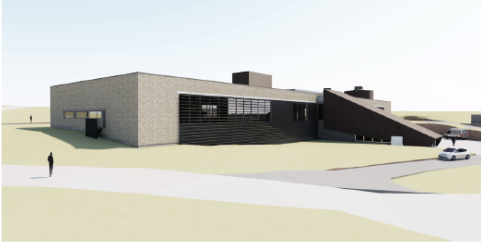
Bildet 1: Fasade av nytt anlegg.