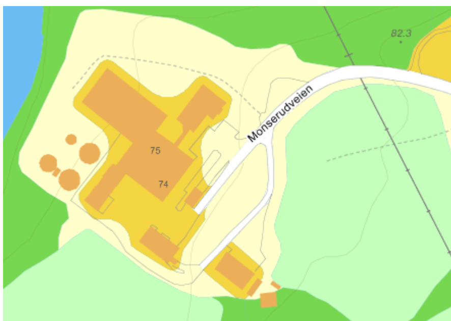
Kart 2: Kart over dagens anlegg.