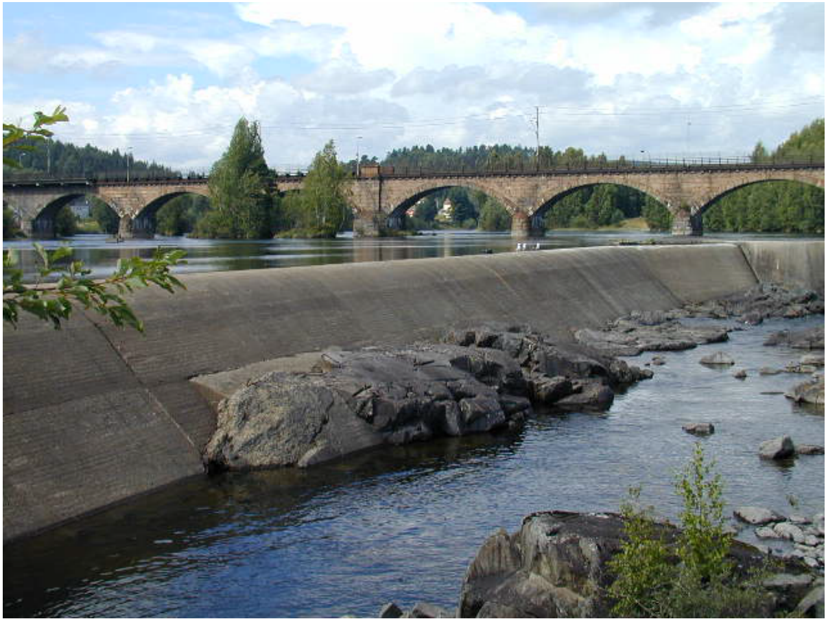
Jernbanebrua og demningen overfor fossen.

Fossen og elvelandskapet er et viktig historiske landskap som gir byen særpreg. Det må løftes bedre fram, men elvene er ustabile og ligger relativt dypt i landskapet. Hvordan kan en gjøre elvene til en attraktiv del av bysentrum og kommunens park og grøntstruktur.