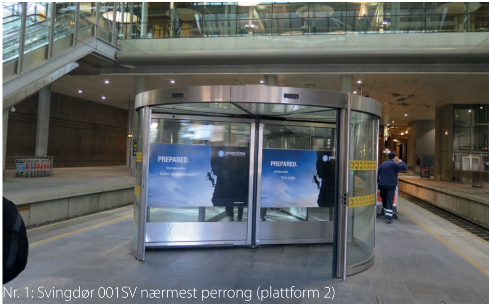
Nr. 1: Svingdør 001SV nærmest perrong (plattform 2)