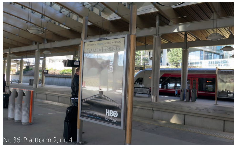
Nr. 36: Plattform 2, nr. 4