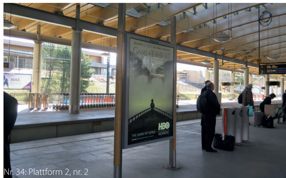
Nr. 34: Plattform 2, nr. 2