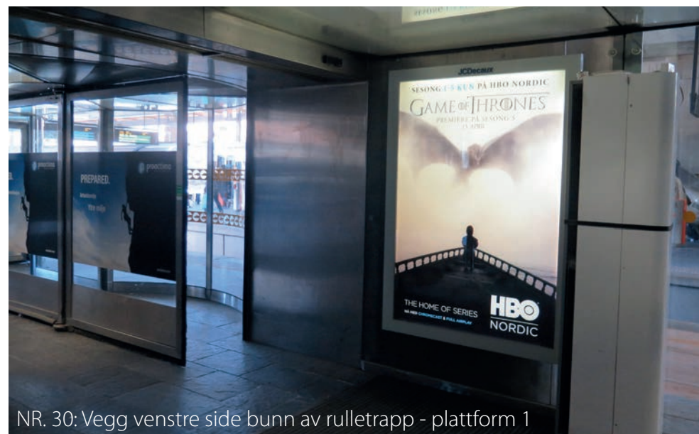
NR. 30: Vegg venstre side bunn av rulletrapp - plattform 1