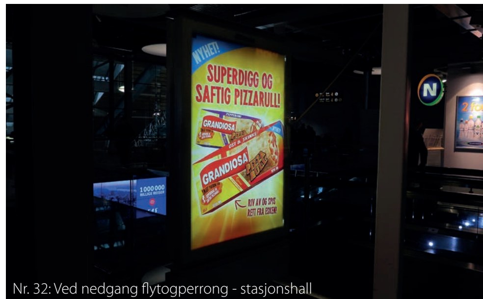
Nr. 32: Ved nedgang flytogperrong - stasjonshall