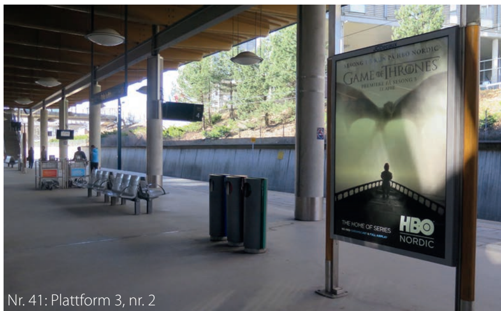
Nr. 41: Plattform 3, nr. 2