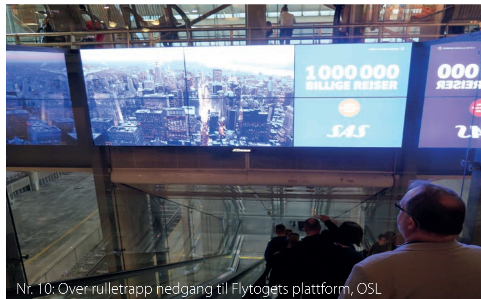
Nr. 10: Over rulletrapp nedgang til Flytogets plattform, OSL