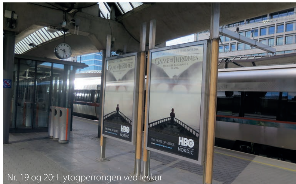
Nr. 19 og 20: Flytogperrongen ved leskur