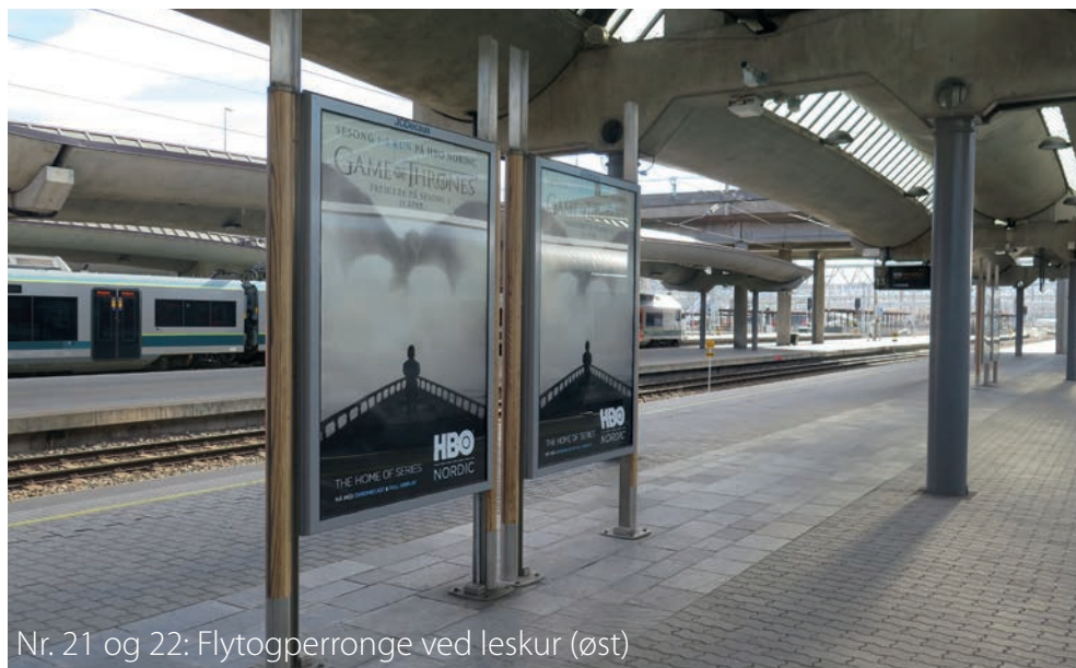
Nr. 21 og 22: Flytogperronge ved leskur (øst)