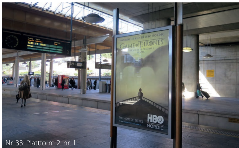
Nr. 33: Plattform 2, nr. 1