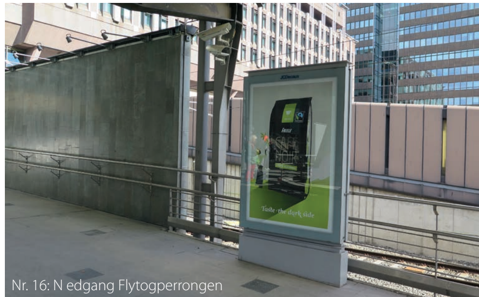
Nr. 16: Nedgang Flytogperrongen