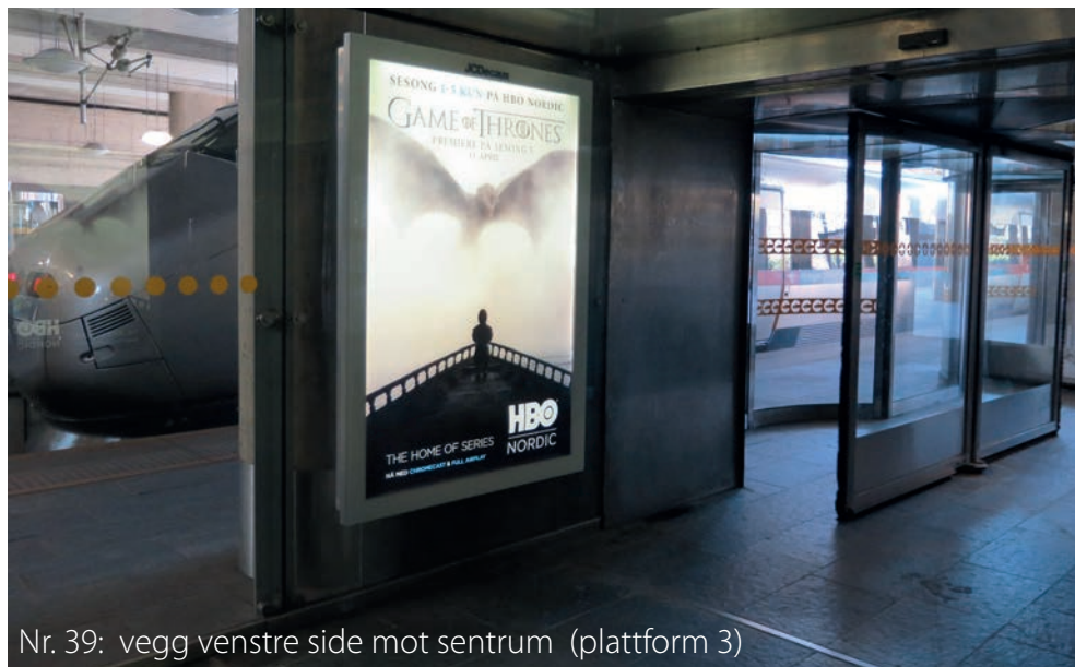
Nr. 39: vegg venstre side mot sentrum (plattform 3)