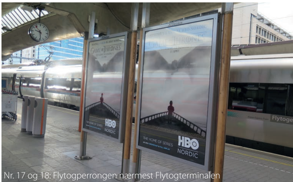
Nr. 17 og 18: Flytogperrongen nærmest Flytogterminalen