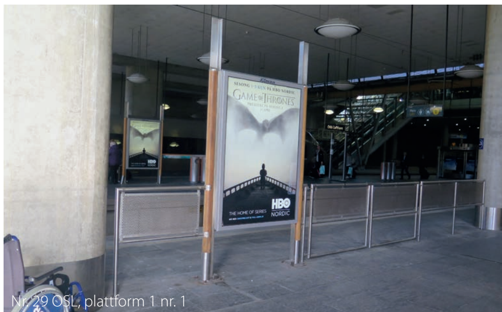
Nr. 29 OSL, plattform 1 nr. 1