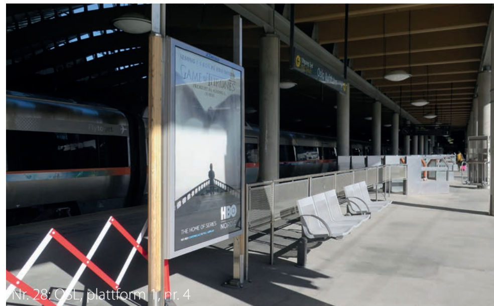
Nr. 28: OSL, plattform 1, nr. 4