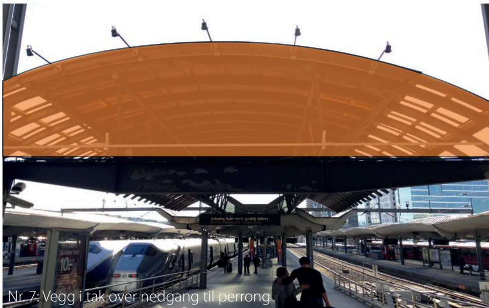
Nr. 7: Vegg i tak over nedgang til perrong