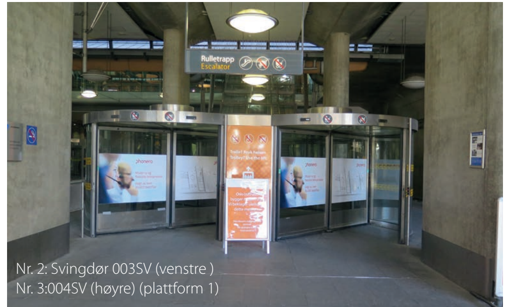
Nr. 2: Svingdør 003SV (venstre) Nr. 3: 004SV (høyre) (plattform 1)