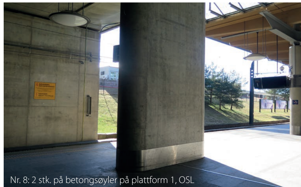
Nr. 8: 2 stk. på betongsøyler på plattform 1, OSL