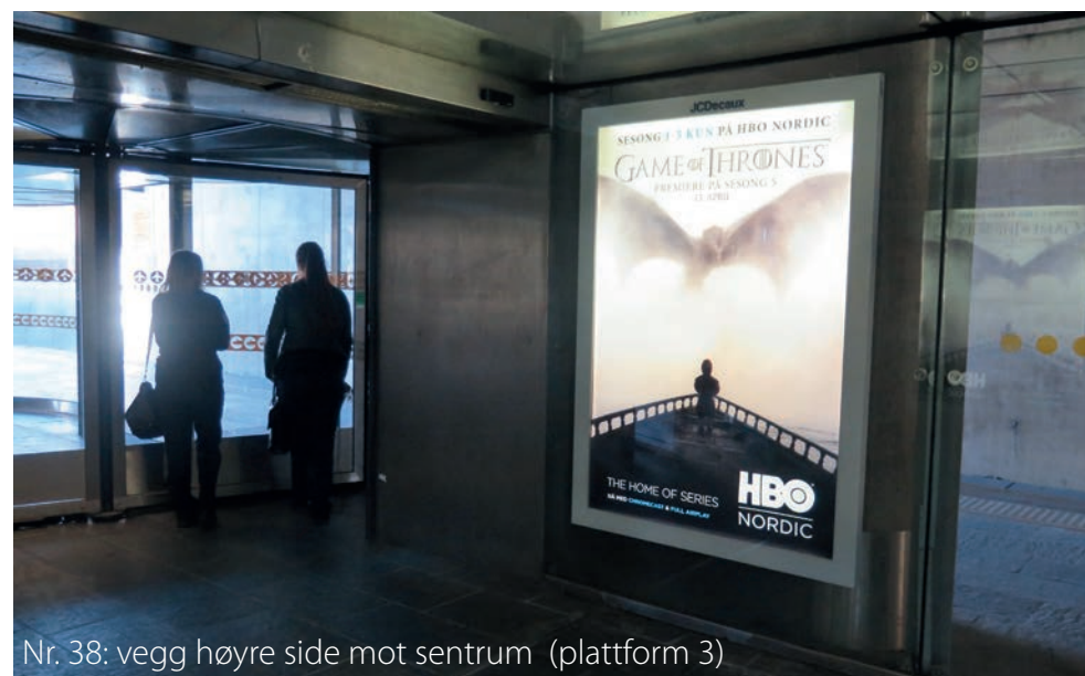
Nr. 38: vegg høyre side mot sentrum (plattform 3)