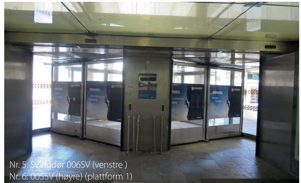
Nr. 5: Svingdør 006SV (venstre) Nr. 6: 005SV (høyre) (plattform 1)