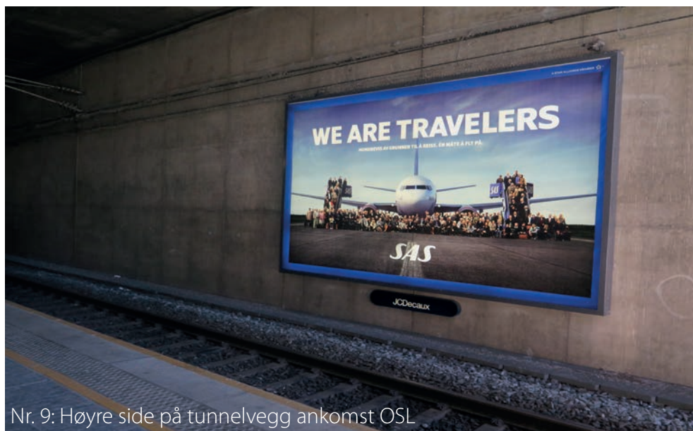
Nr. 9: Høyre side på tunnelvegg ankomst OSL