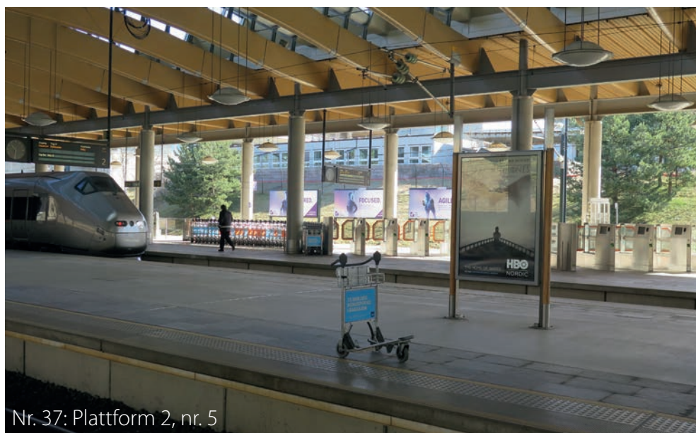
Nr. 37: Plattform 2, nr. 5