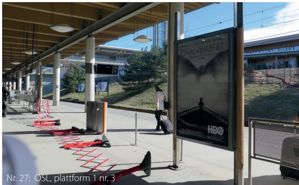
Nr. 27: OSL, plattform 1 nr. 3