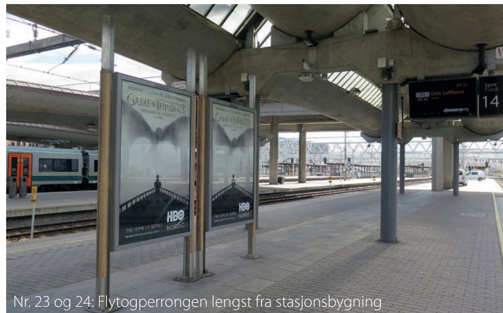
Nr. 23 og 24: Flytogperrongen lengst fra stasjonsbygning