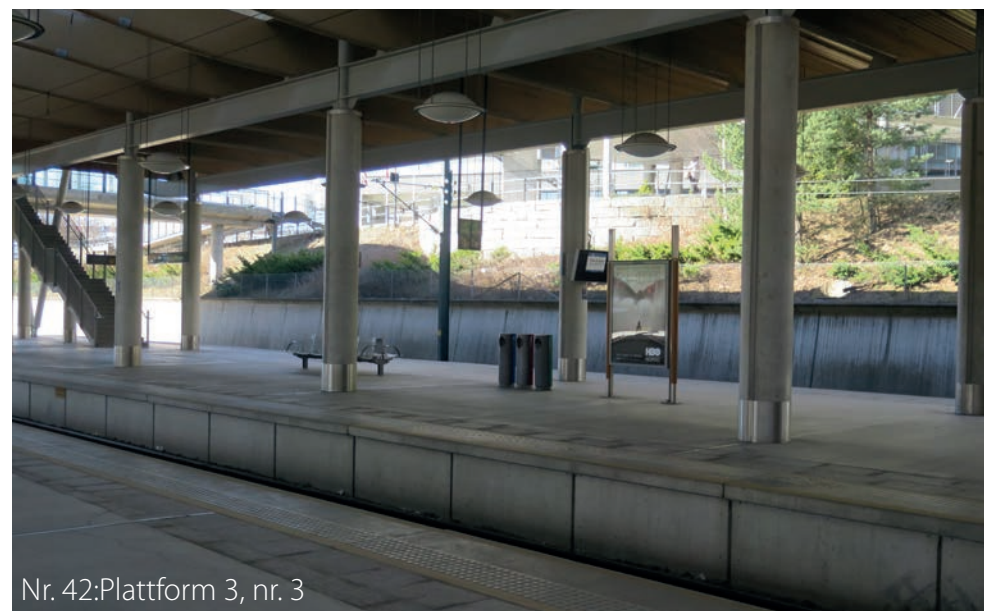
Nr. 42: Plattform 3, nr. 3