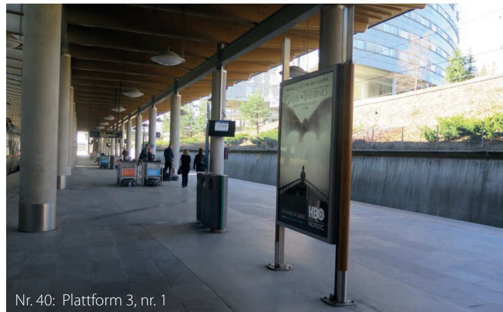
Nr. 40: Plattform 3, nr. 1