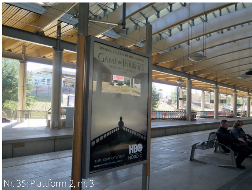
Nr. 35: Plattform 2, nr. 3