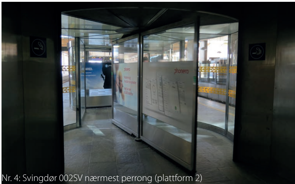
Nr. 4: Svingdør 002SV nærmest perrong (plattform 2)