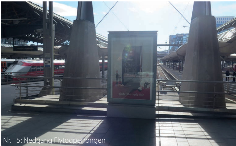
Nr. 15: Nedgang Flytogperrongen