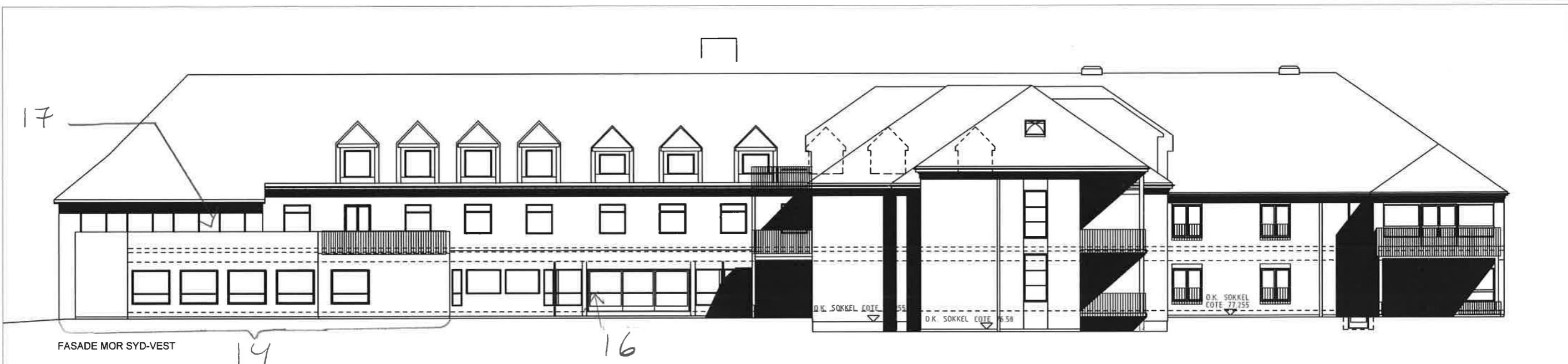
FASADE MOR SYD-VEST