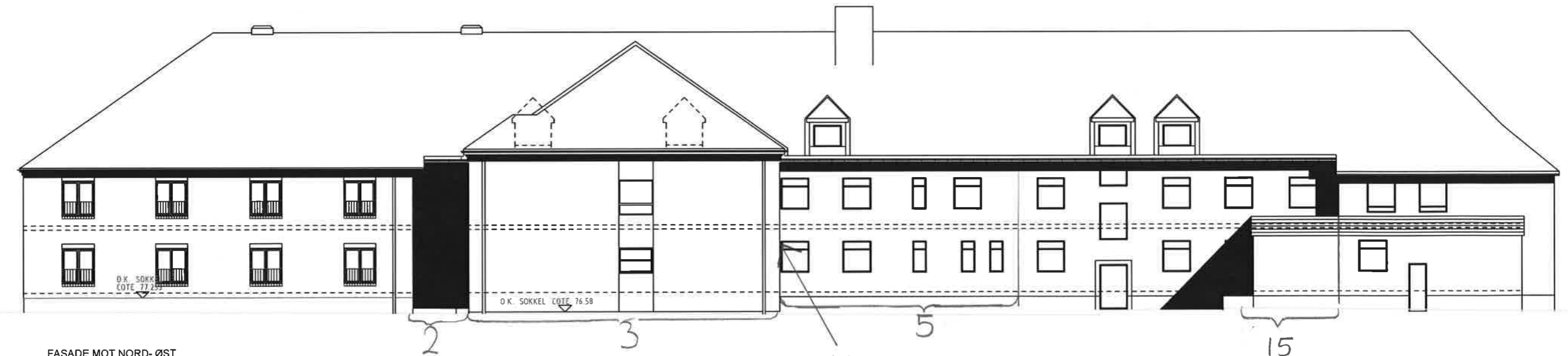
FASADE MOT NORD-ØST