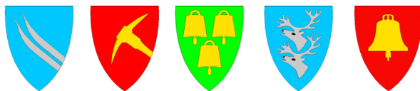
Alvdal Folldal Os Rendalen Tolga