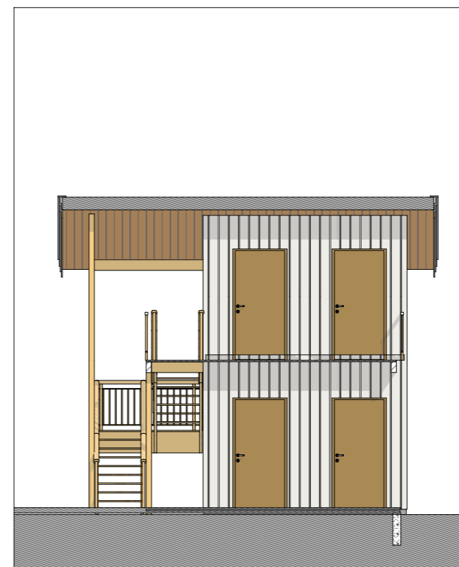
Fasade sør boder