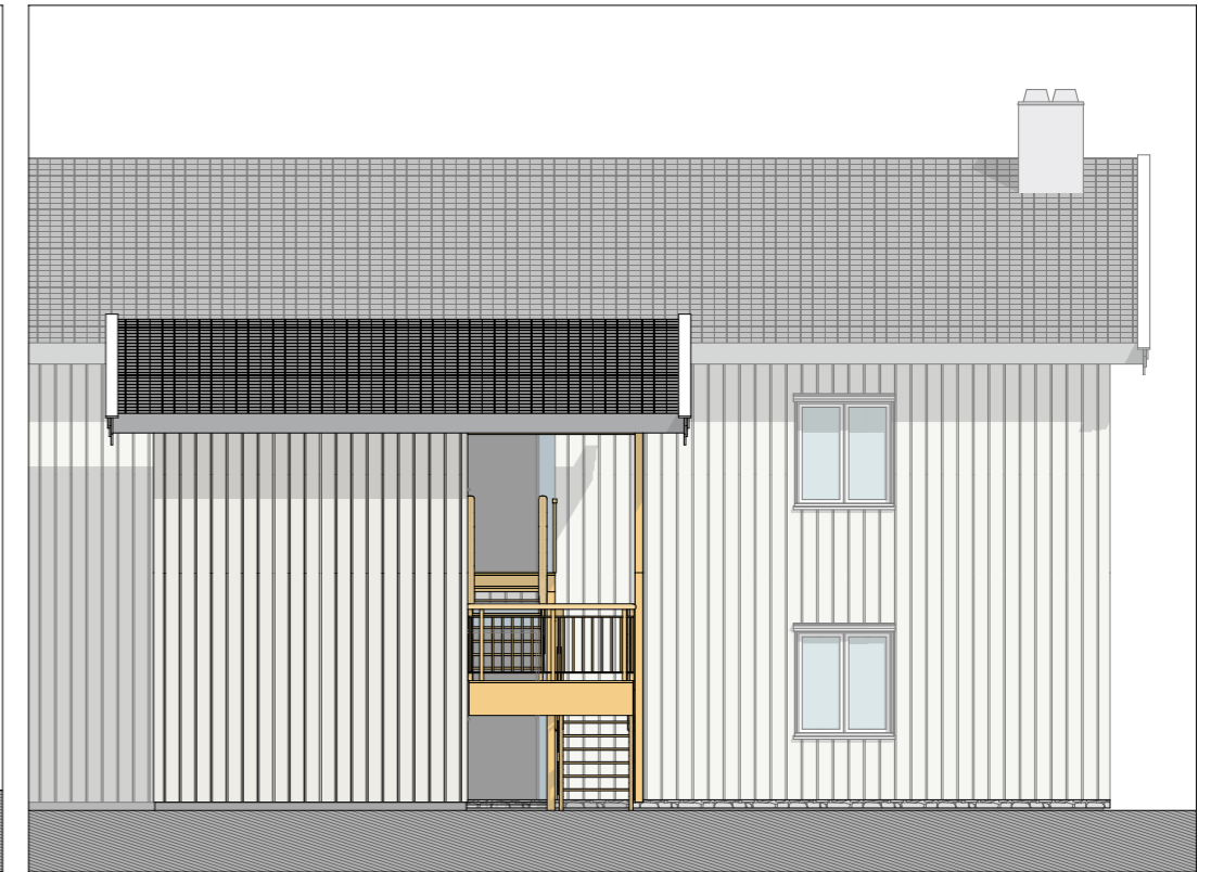
Fasade nord + bod