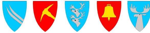
Alvdal Folldal Rendalen Tolga Tynset