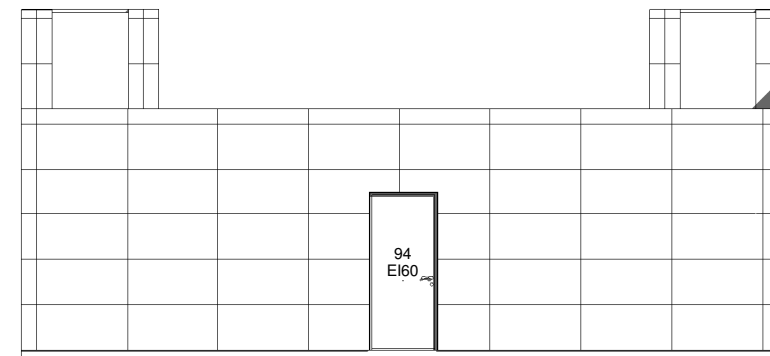
2 Sør 1 : 100