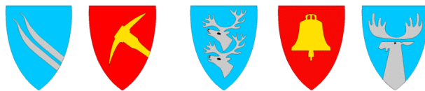
Alvdal Folldal Rendalen Tolga Tynset