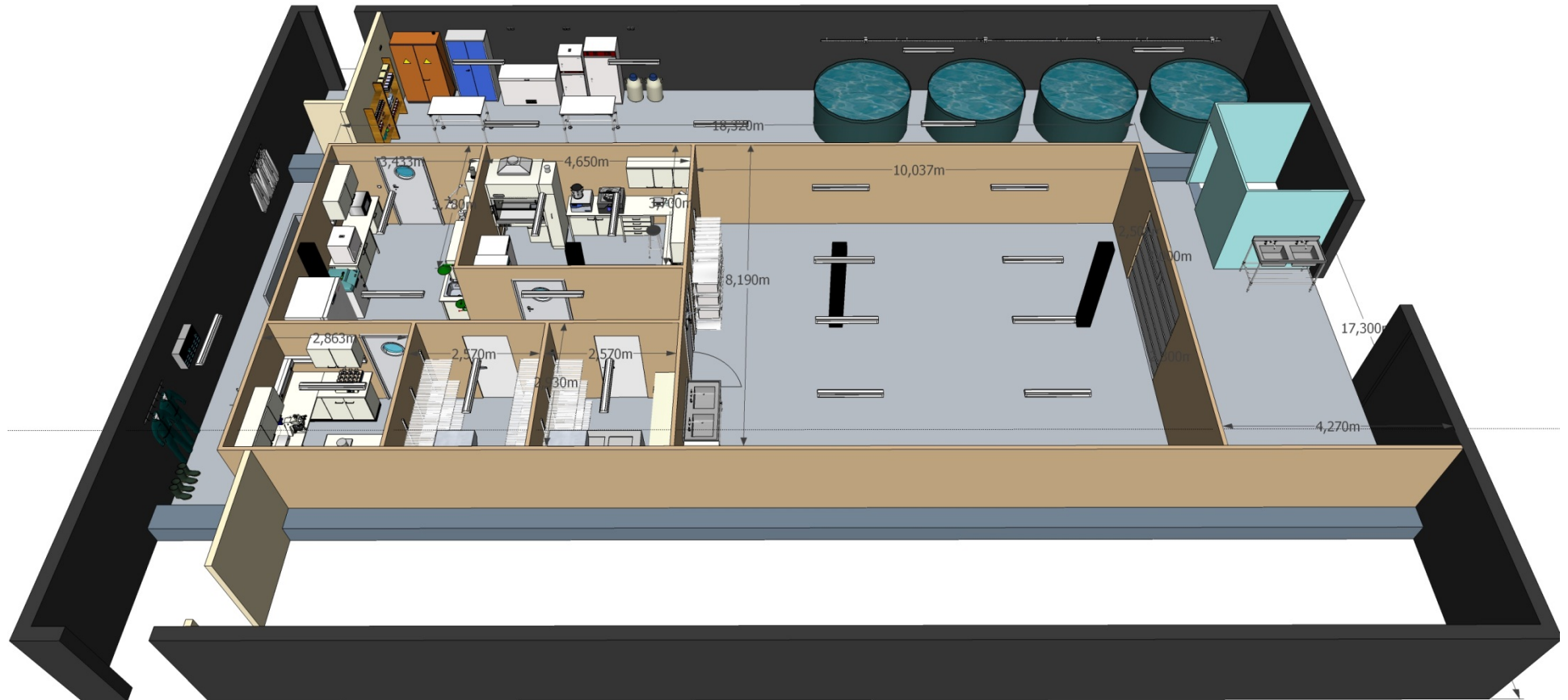
Figur 1: Hall 7 plantegningen