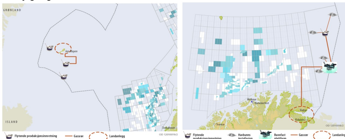
Høyt aktivitetsnivå Jan Mayen

Oljedirektoratet utarbeider scenarier/ fremtidsbilder for petroleumsvirksomhet i de enkelte havområdene (hhv. høyt og lavt scenario for hvert område). Her inngår aktiviteter til havs samt landanlegg, og det utarbeides utslippsprognoser for disse fremtidsbildene. Det vil gjøres studier for, på et generelt grunnlag, å vurdere muligheten for elektrifisering av petroleumsvirksomhet i Barentshavet sørøst. Det kan således være aktuelt å vurdere utslipp til luft basert på to sett av utslippsprognoser (med og uten elektrifisering). Nedenfor følger en foreløpig angivelse av felt i fremtidsbildene for de to havområdene.