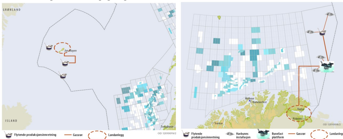
Høyt aktivitetsnivå Jan Mayen (3 felt)

Oljedirektoratet utarbeider scenarier/fremtidsbilder for petroleumsvirksomhet i de enkelte havområdene. Disse angir antall felt og tilhørende infrastruktur, samt omtrentlig lokalisering. Nedenfor følger en foreløpig angivelse av felt i fremtidsbildene for de to havområdene.