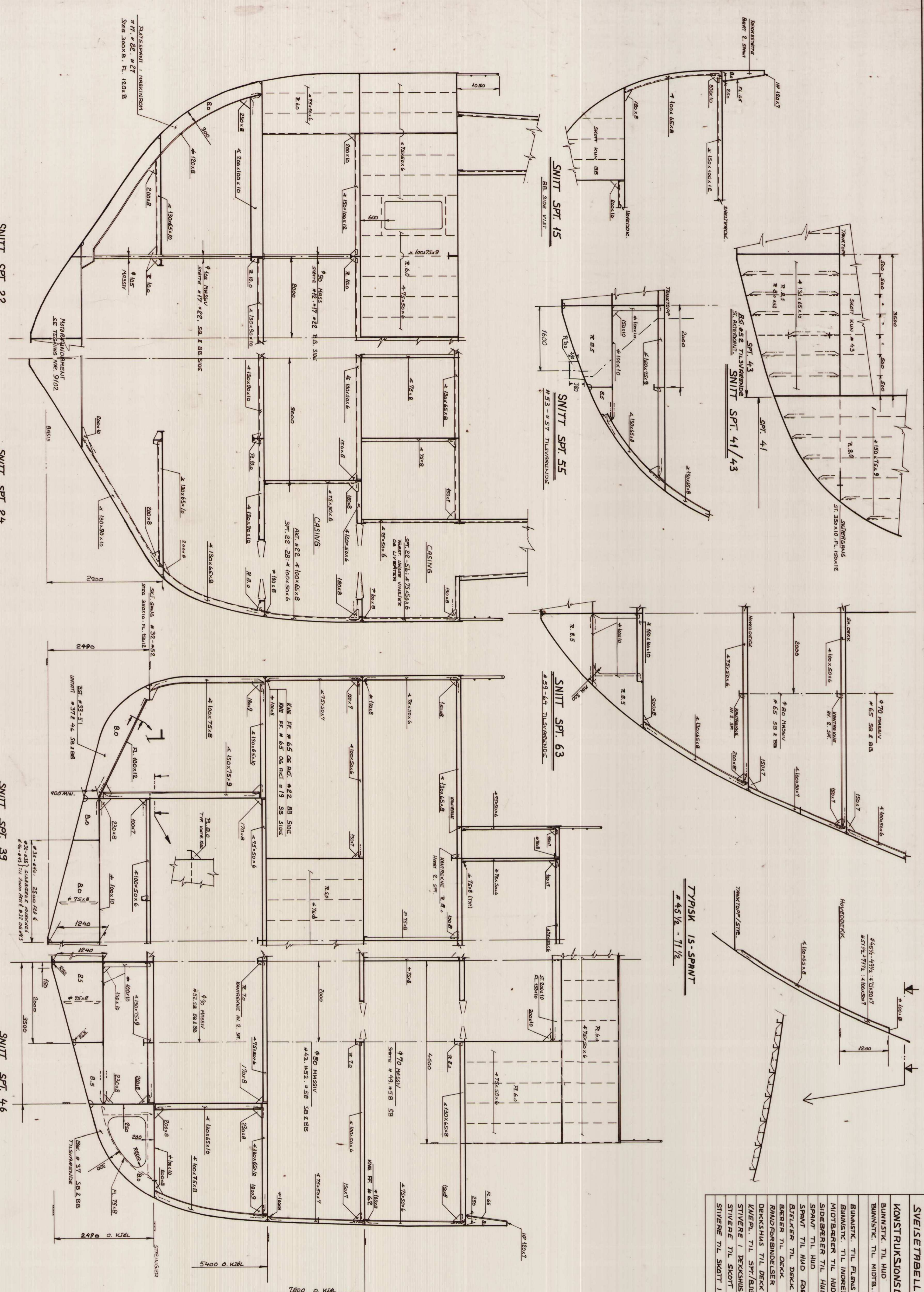
TYPIK 15-SPRINT # 45 1/2 - 71 1/2