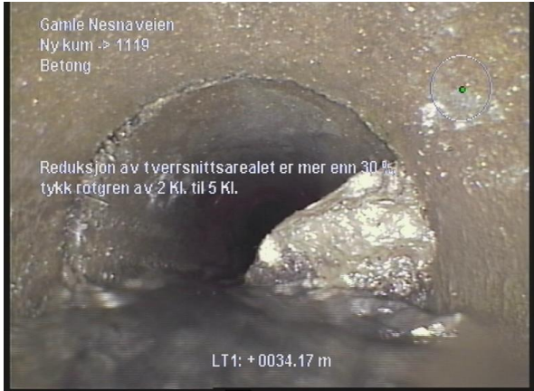
13.11.2024 135958_Ny kum_1119_13112024_020023_035.jpg, 00:00:00, 34.17m Reduksjon av tverrsnittsarealet er mer enn 30 %, tykk rotgren av 2 Kl. til 5 Kl.