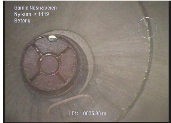
13.11.2024 135958_Ny kum_1119_13112024_020023_036.jpg, 00:00:47, 35.90m Inspeksjon fullført