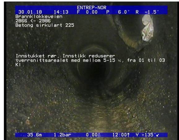
Foto: Innstukket rør, Innstikk reduserer tverrsnittetsarealet med mellom 5-15 %, fra 01 til 03 Kl._1317.JPG 35,68m, Innstukket rør, Innstikk reduserer tverrsnittetsarealet med mellom 5-15 %, fra 01 til 03 Kl.