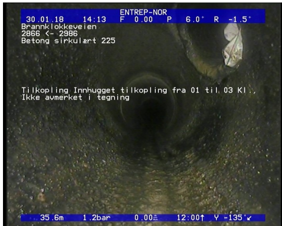
Foto: Tilkopling Innhugget tilkopling fra 01 til 03 Kl., Ikke avmerket i tegning_13174635,68_TK.JPG 35,68m, Tilkopling Innhugget tilkopling fra 01 til 03 Kl., Ikke avmerket i tegning