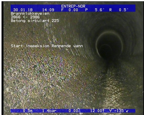
Foto: Start inspeksjon Rennende vann_1313280,5_SI.JPG 0,5m, Start inspeksjon Rennende vann