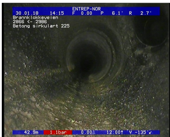
Foto: Tilkopling Kjerneboret tilkopling fra 01 til 03 Kl., Ikke avmerket i tegning_13193042,99_TK.JPG 42,99m, Tilkopling Kjerneboret tilkopling fra 01 til 03 Kl., Ikke avmerket i tegning