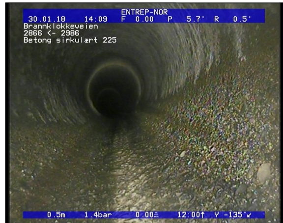
Foto: Korrosjon/Slitasje Synlig tilslag (rørveggen er betydelig påvirket), I betongrør er tilslagsmat.JPG 0,5m, Korrosjon/Slitasje Synlig tilslag (rørveggen er betydelig påvirket), I betongrør er tilslagsmaterialet tydelig blottlagt, fra 04 til 08 Kl., Start