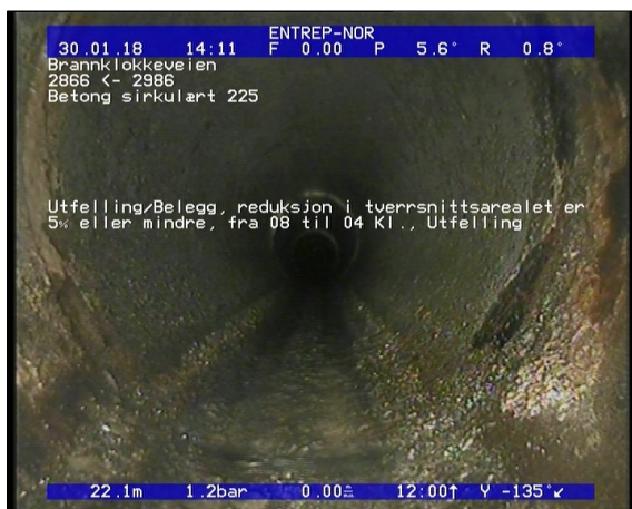
Foto: Utfelling/Belegg, reduksjon i tverrsnittsarealet er 5 eller mindre, fra 08 til 04 Kl., Utfelli.JPG 22,18m, Utfelling/Belegg, reduksjon i tverrsnittsarealet er 5% eller mindre, fra 08 til 04 Kl., Utfelling, Start