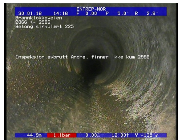
Foto: Inspeksjon avbrutt Andre, finner ikke kum 2986_13210844,95_IA.JPG 44,95m, Inspeksjon avbrutt Andre, finner ikke kum 2986