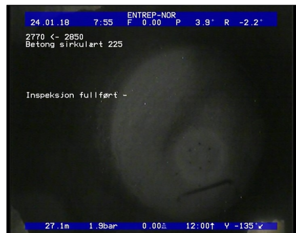
Foto: Inspeksjon fullført -_06594527,13_IF.JPG 27,13m, Inspeksjon fullført -