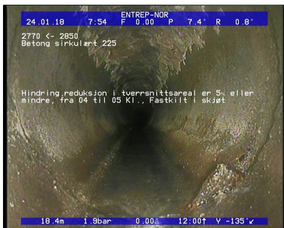
Foto: Hindring, reduksjon i tverrsnittsareal er 5 eller mindre, fra 04 til 05 Kl., Fastkilt i skjøt_0.JPG 18,43m, Hindring, reduksjon i tverrsnittsareal er 5% eller mindre, fra 04 til 05 Kl., Fastkilt i skjøt