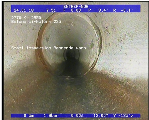
Foto: Start inspeksjon Rennende vann_0655440,5_SI.JPG 0,5m, Start inspeksjon Rennende vann