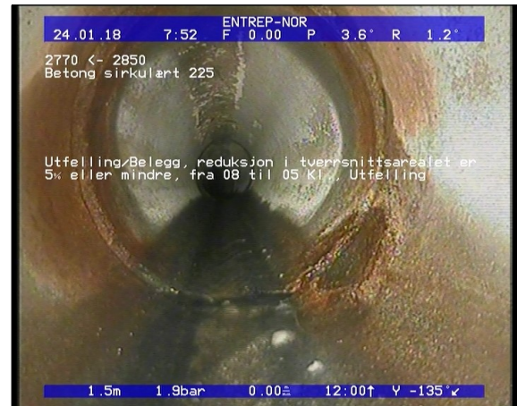
Foto: Utfelling/Belegg, reduksjon i tverrsnittsarealet er 5 eller mindre, fra 08 til 05 Kl., Utfelli.JPG 1,55m, Utfelling/Belegg, reduksjon i tverrsnittsarealet er 5% eller mindre, fra 08 til 05 Kl., Utfelling, Start