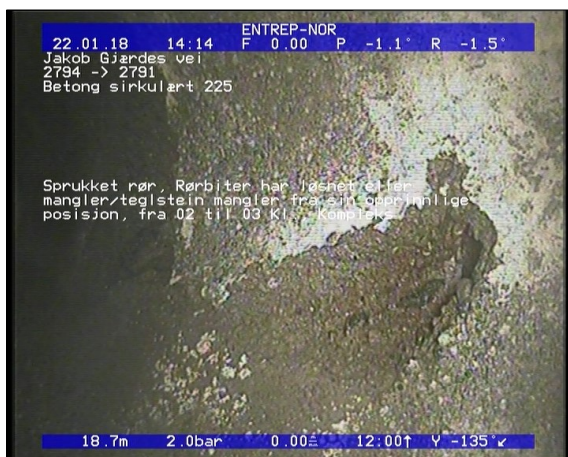
Foto: Sprukket rør, Rørbiter har løsnet eller manglerteglstein mangler fra sin opprinnlige posisjon,.JPG 18,73m, Sprukket rør, Rørbiter har løsnet eller mangler/teglstein mangler fra sin opprinnlige posisjon, fra 02 til 03 Kl., Kompleks