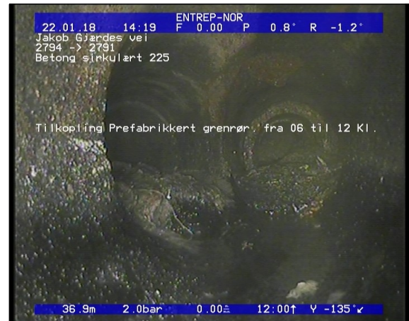
Foto: Tilkopling Prefabrikkert grenrør. fra 06 til 12 Kl._22012018_36,91_TK.JPG 36,91m, Tilkopling Prefabrikkert grenrør. fra 06 til 12 Kl.