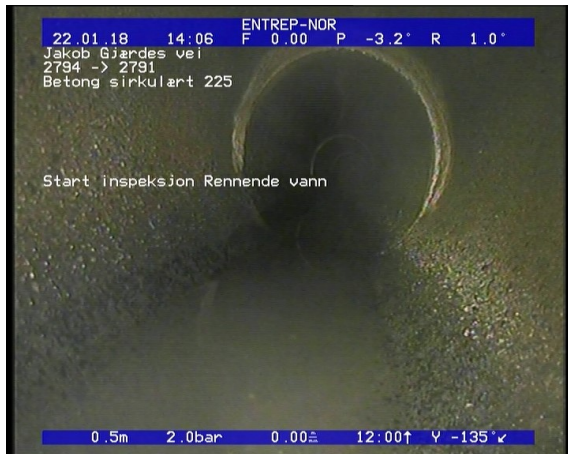
Foto: Start inspeksjon Rennende vann_22012018_0,5_SI.JPG 0,5m, Start inspeksjon Rennende vann