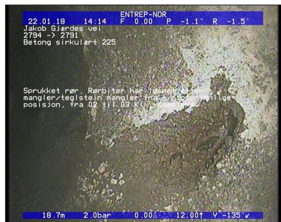
Foto: Sprukket rør, Rørbiter har løsnet eller manglerteglstein mangler fra sin opprinnlige posisjon, fra 02 til 03 Kl., Kompleks, Start_22012018_16,21, JPG 16,21m, Sprukket rør, Rørbiter har løsnet eller mangler/teglstein mangler fra sin opprinnlige posisjon, fra 12 til 12 Kl., Kompleks