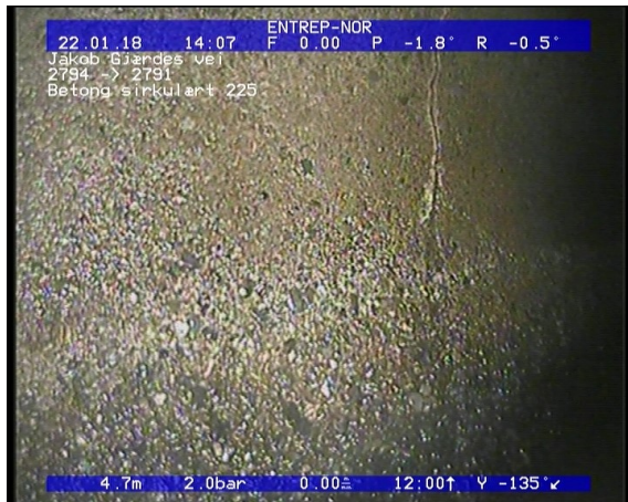
Foto: Sprukket rør, sprekkene er åpneløse teglstein, fra 12 til 12 Kl., Tangentiell_22012018_4,59_SR.JPG 4,59m, Sprukket rør, sprekkene er åpne/løse teglstein, fra 12 til 12 Kl., Tangentiell