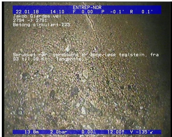
Foto: Sprukket rør, sprekke er åpne/løse teglstein, fra 03 til 09 Kl., Tangentiell_22012018_13,83_S.JPG 13,83m, Sprukket rør, sprekke er åpne/løse teglstein, fra 03 til 09 Kl., Tangentiell