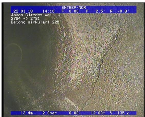
Foto: Sprukket rør, sprekkene er åpneløse teglstein, fra 12 til 12 Kl., Kompleks_22012018_13,41_SR2.JPG 13,41m, Sprukket rør, sprekkene er åpne/løse teglstein, fra 12 til 12 Kl., Kompleks