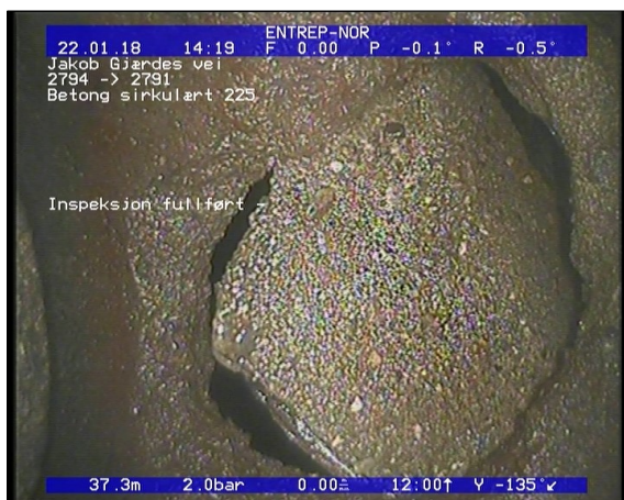
Foto: Inspeksjon fullført - _22012018_37,31_IF.JPG 37,31m, Inspeksjon fullført -