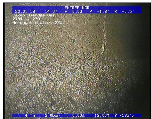
Foto: Sprukket rør, sprekken er åpneløse teglstein, fra 12 til 12 Kl., Tangentiell_22012018_4,59_SR.JPG 4,59m, Sprukket rør, sprekken er åpne/løse teglstein, fra 12 til 12 Kl., Tangentiell