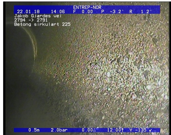
Foto: Korrosjon/Slitasje Synlig tilslag (rørveggen er betydelig påvirket), I betongrør er tilslagsmat.JPG 0,5m, Korrosjon/Slitasje Synlig tilslag (rørveggen er betydelig påvirket), I betongrør er tilslagsmaterialet tydelig blottlagt, fra 04 til 08 Kl., Start