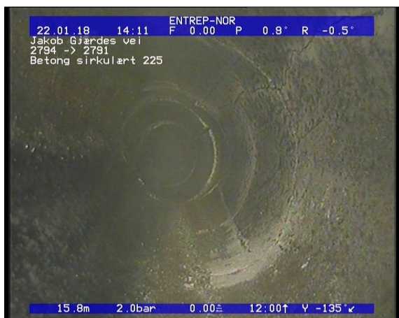
Foto: Sprukket rør, sprekke er åpne/løse teglstein, fra 12 til 12 Kl., Kompleks, Start_22012018_15, JPG 15,56m, Sprukket rør, sprekke er åpne/løse teglstein, fra 12 til 12 Kl., Kompleks, Start