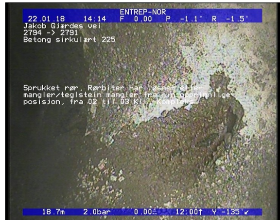
Foto: Sprukket rør, Rørbiter har løsnet eller manglerteglstein mangler fra sin opprinnlige posisjon,.JPG 16,86m, Sprukket rør, Rørbiter har løsnet eller mangler/teglstein mangler fra sin opprinnlige posisjon, fra 06 til 11 Kl., Tangentiell