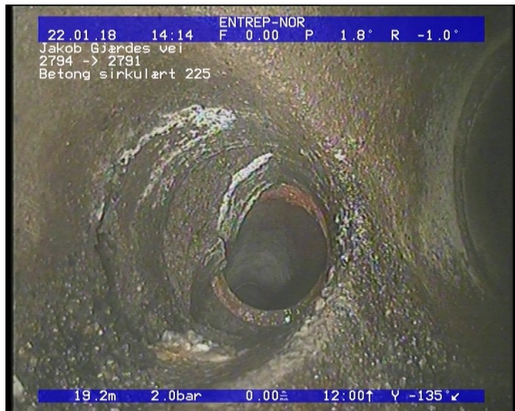
Foto: Tilkopling Prefabrikkert grenrør. fra 09 til 11 Kl., Ikke avmerket i tegning_22012018_19,09_TK.JPG 19,09m, Tilkopling Prefabrikkert grenrør. fra 09 til 11 Kl., Ikke avmerket i tegning