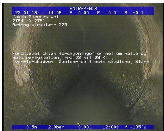
Foto: Forskjøvet skjøt forskyvningen er mellom halve og hele rørtykkelsen, fra 03 til 09 Kl., Tverrfø.JPG 0,5m, Forskjøvet skjøt forskyvningen er mellom halve og hele rørtykkelsen, fra 03 til 09 Kl., Tverrforskjøvet, Gjelder de fleste skjøtene, Start