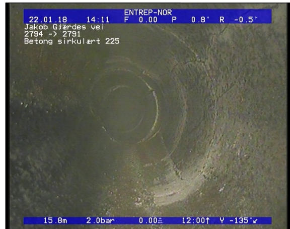
Foto: Sprukket rør, sprekke er åpne/løse teglstein, fra 12 til 12 Kl., Kompleks, Start_22012018_15, JPG 15,56m, Sprukket rør, sprekke er åpne/løse teglstein, fra 12 til 12 Kl., Kompleks, Start