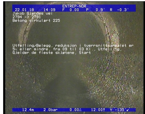
Foto: Utfelling/Belegg, reduksjon i tverrsnittsarealet er 5 eller mindre, fra 09 til 03 Kl., Utfelli.JPG 12,45m, Utfelling/Belegg, reduksjon i tverrsnittsarealet er 5% eller mindre, fra 09 til 03 Kl., Utfelling, Gjelder de fleste skjøtene, Start