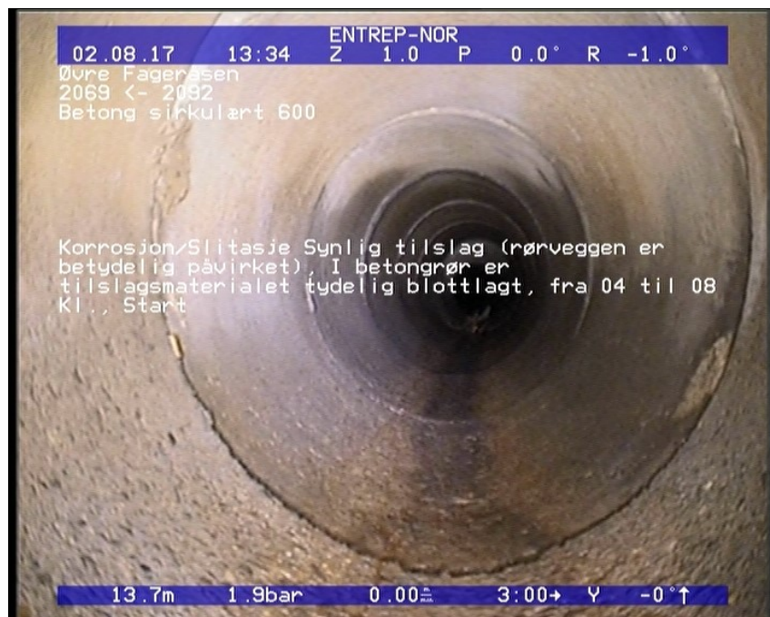
Foto: 49_49_947_A.JPG 13,78m, Korrosjon/Slitasje Synlig tilslag (rørveggen er betydelig påvirket), I betongrør er tilslagsmaterialet tydelig blottlagt, fra 04 til 08 Kl., Start