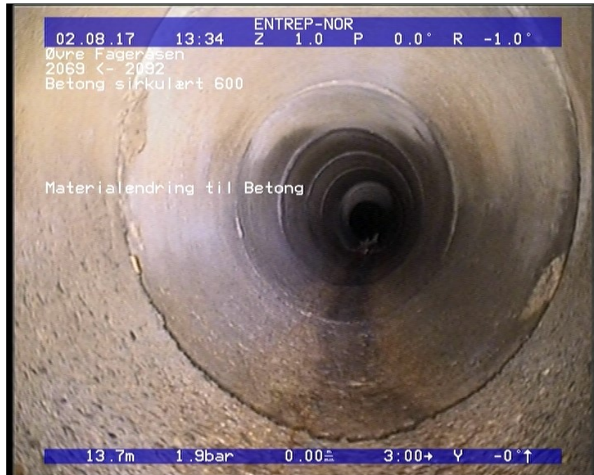
Foto: 49_49_946_A.JPG 13,78m, Materialendring til Betong