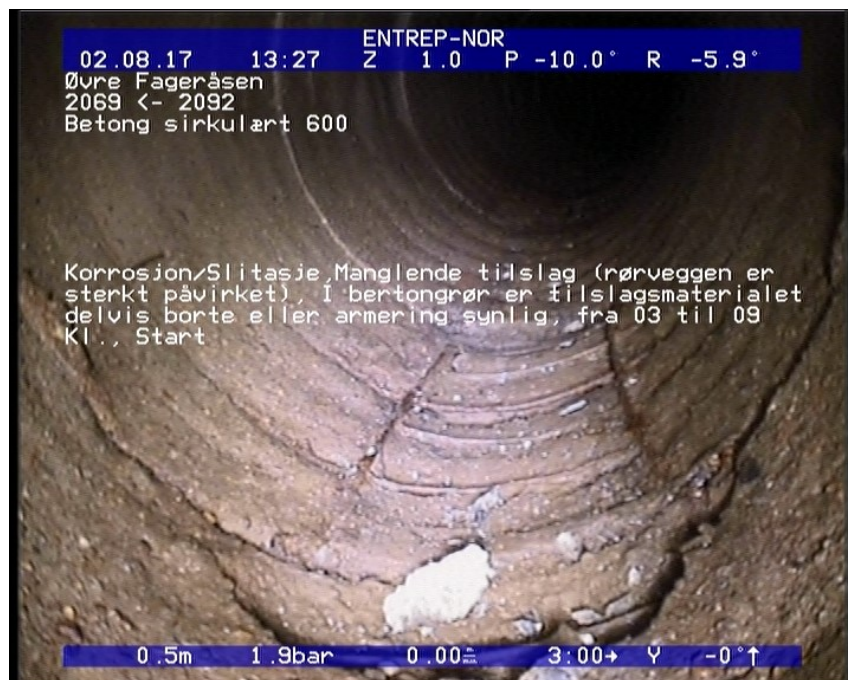
Foto: 49_49_941_A.JPG 0,5m, Korrosjon/Slitasje, Manglende tilslag (rørveggen er sterkt påvirket), I bertongrør er tilslagsmaterialet delvis borte eller armering synlig, fra 03 til 09 Kl., Start