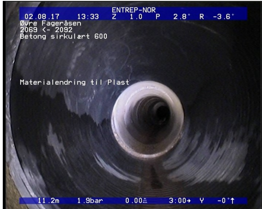
Foto: 49_49_945_A.JPG 11,27m, Materialendring til Plast