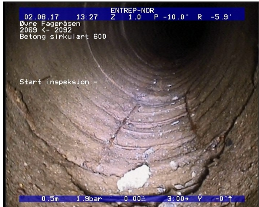
Foto: 49_49_49_A.JPG 0,5m, Start inspeksjon -