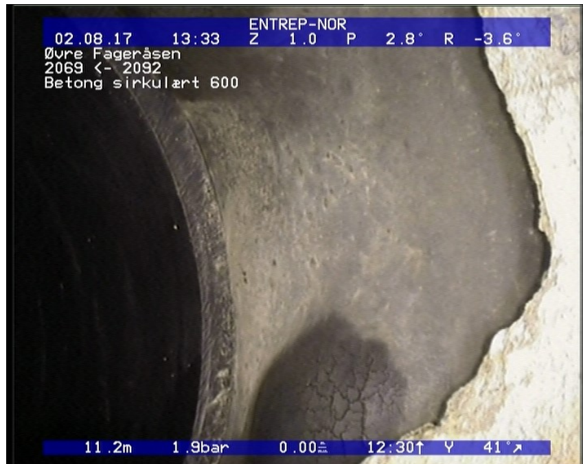
Foto: 49_49_945_B.JPG 11,27m, Materialendring til Plast